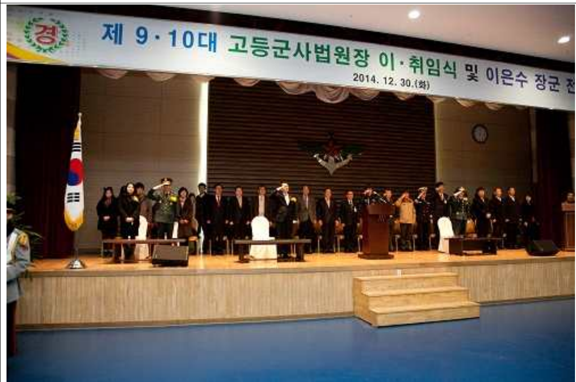
제9·10대 고등군사법원장 이·취임식 (2014.12.30.)