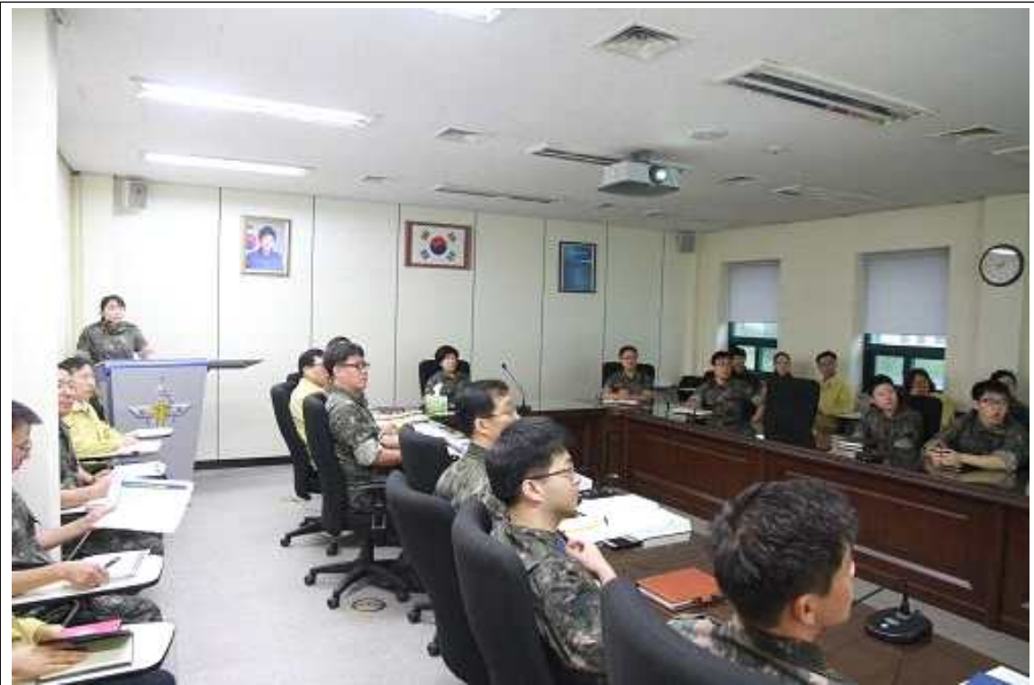
2014년도 을지연습 참가 (2014.08.18.~08.21.)