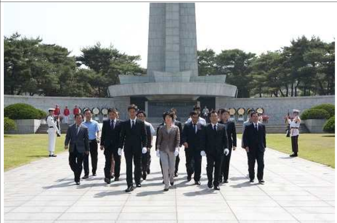
현충원 한송이 헌화 행사 (2014.05.27.)