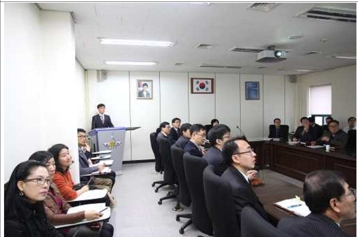
전화친절도 교육 (2014.01.08.)