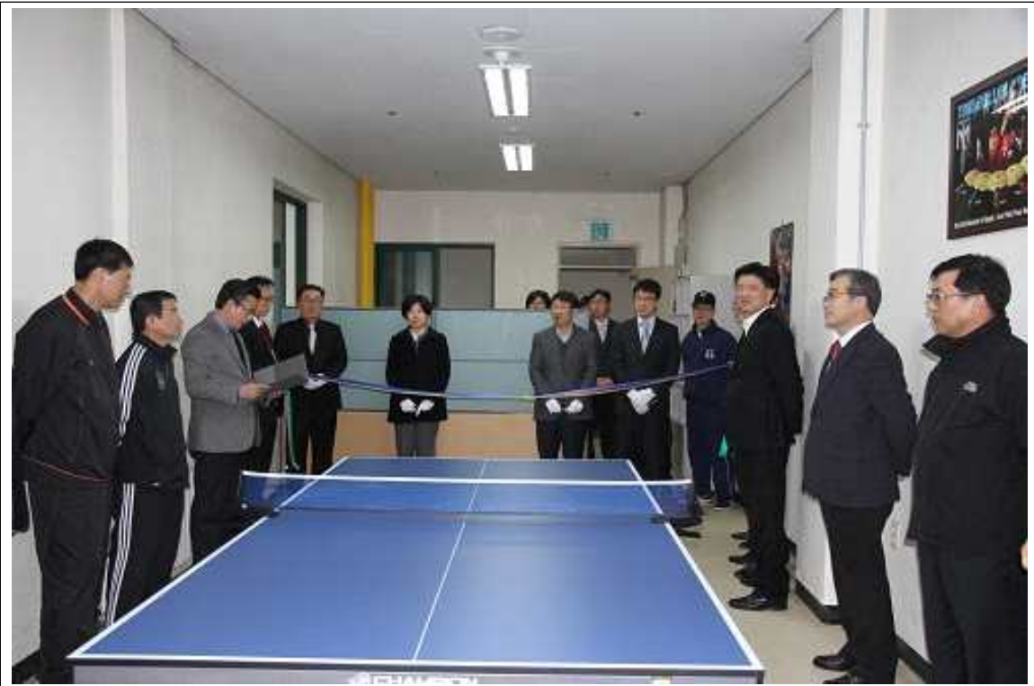
법원 & 검찰 공용 탁구장 개장 (2014.03.12.)