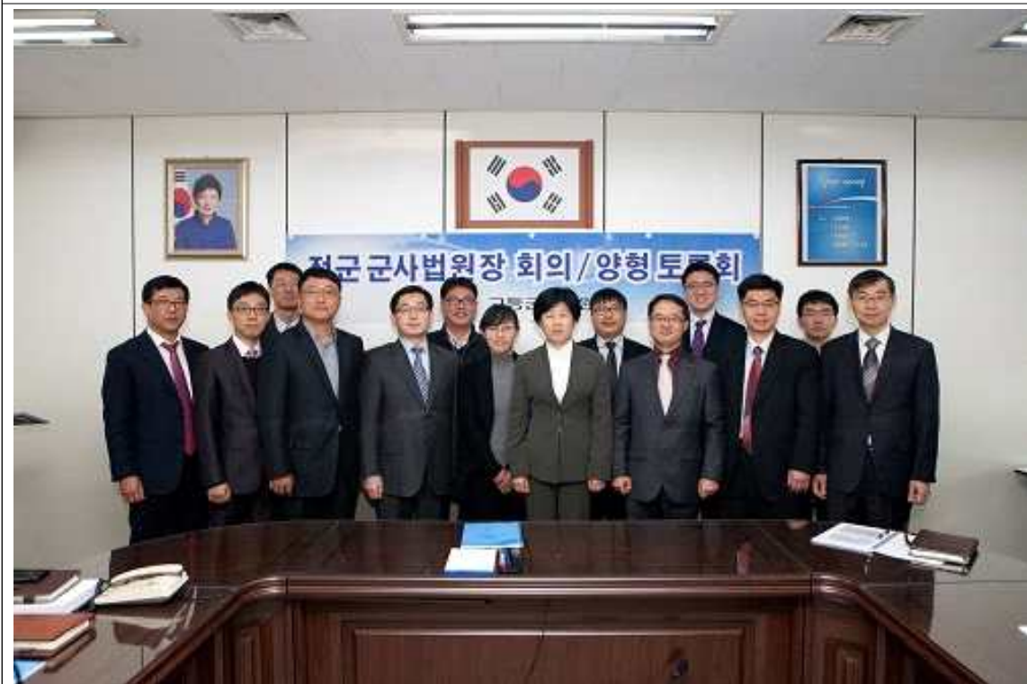
전군 군사법원장 회의 및 양형토론회 (2014.12.05.)