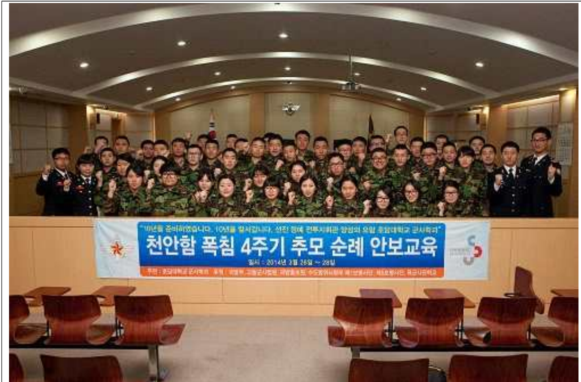
초당대 군사학과 법원 방문 (2014.03.26.)