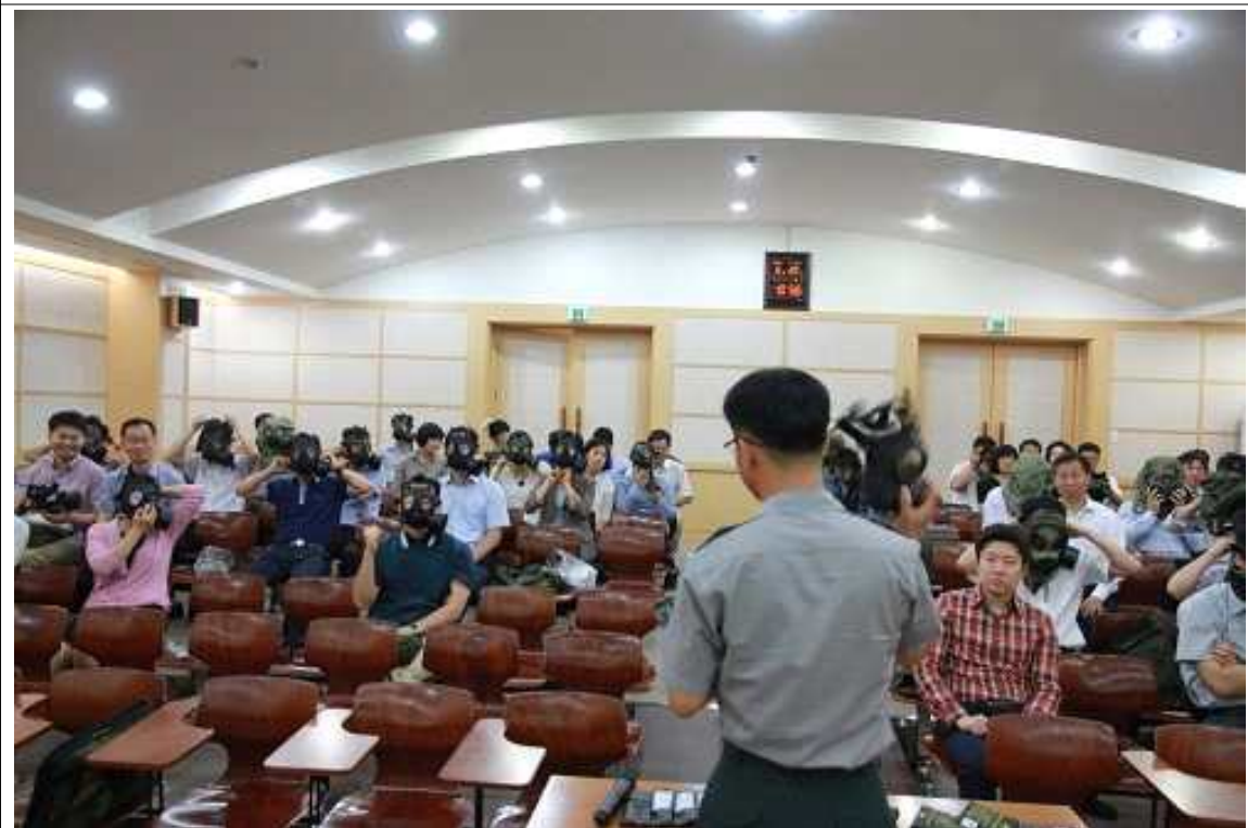
화생방장비 사용 교육 (2014.06.20.)