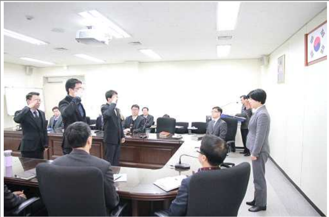
연말 성과분석회의 (2014.12.17.)