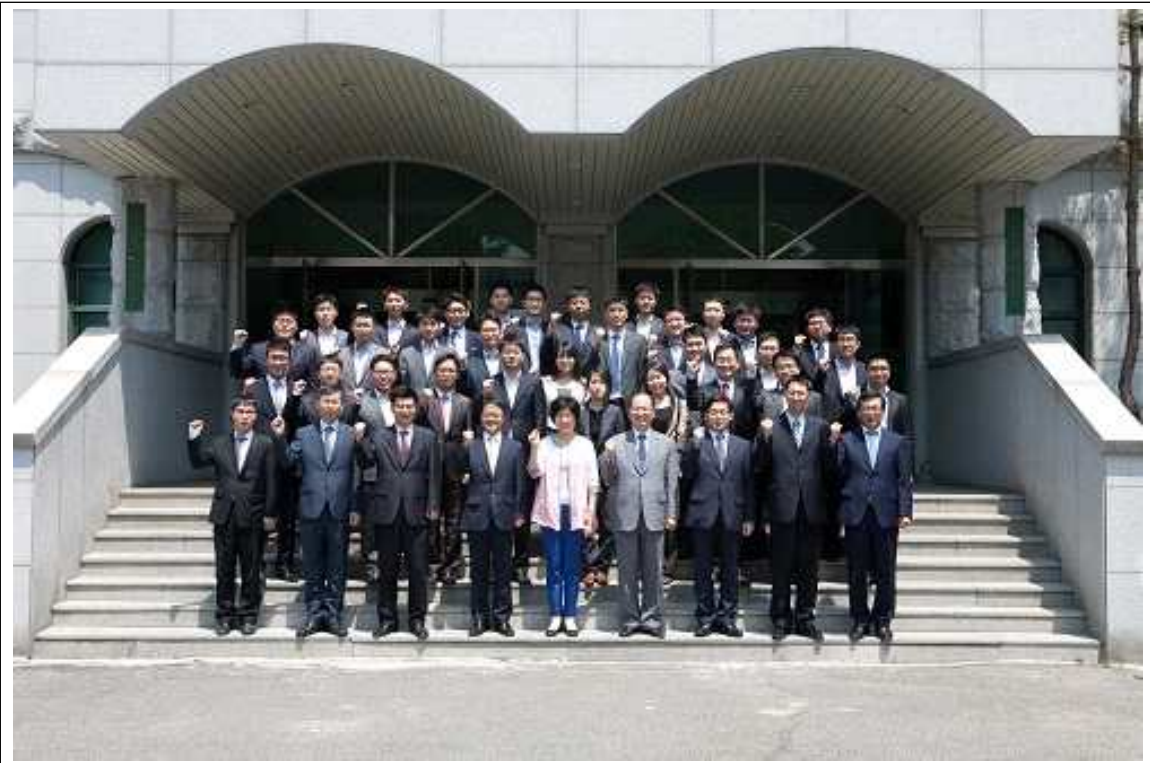
2014년 전군 군판사 직무 교육 (2014.05.28.~05.30.)