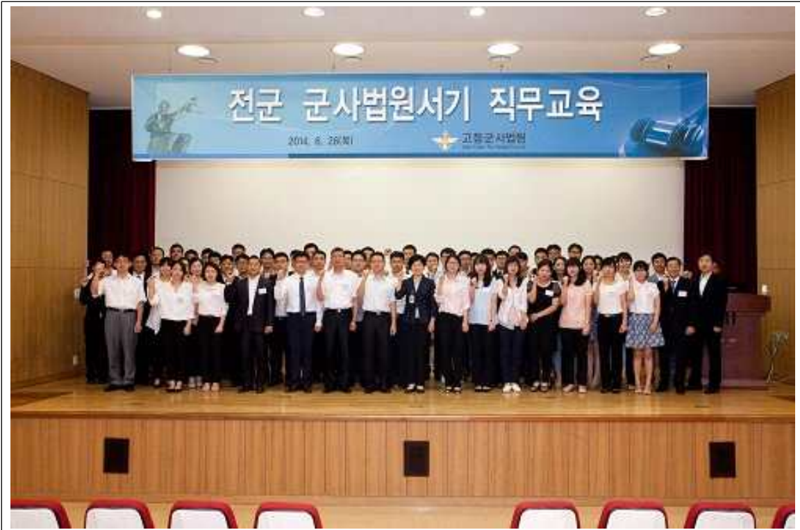
2014년 전군 군사법원서기 직무 교육 (2014.06.26.)