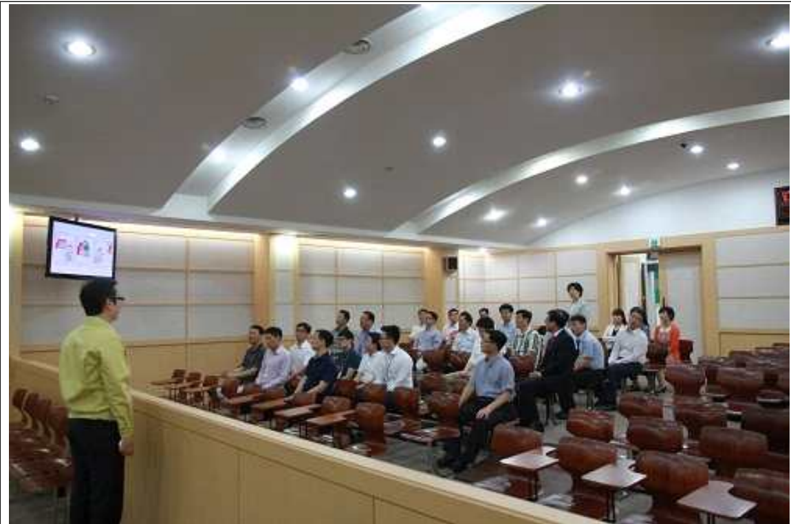
재난대비 대피훈련 및 소방안전 교육 (2014.05.23.)