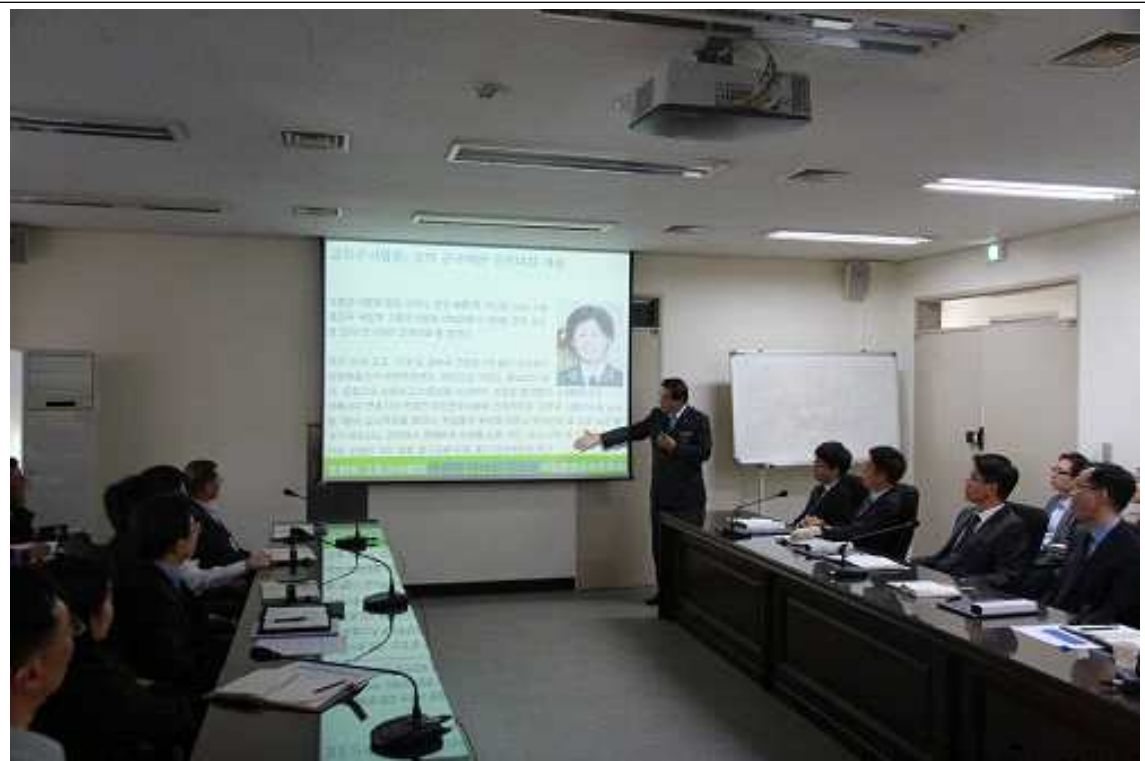
성공사관학교장 교양 교육 (2014.10.08.)