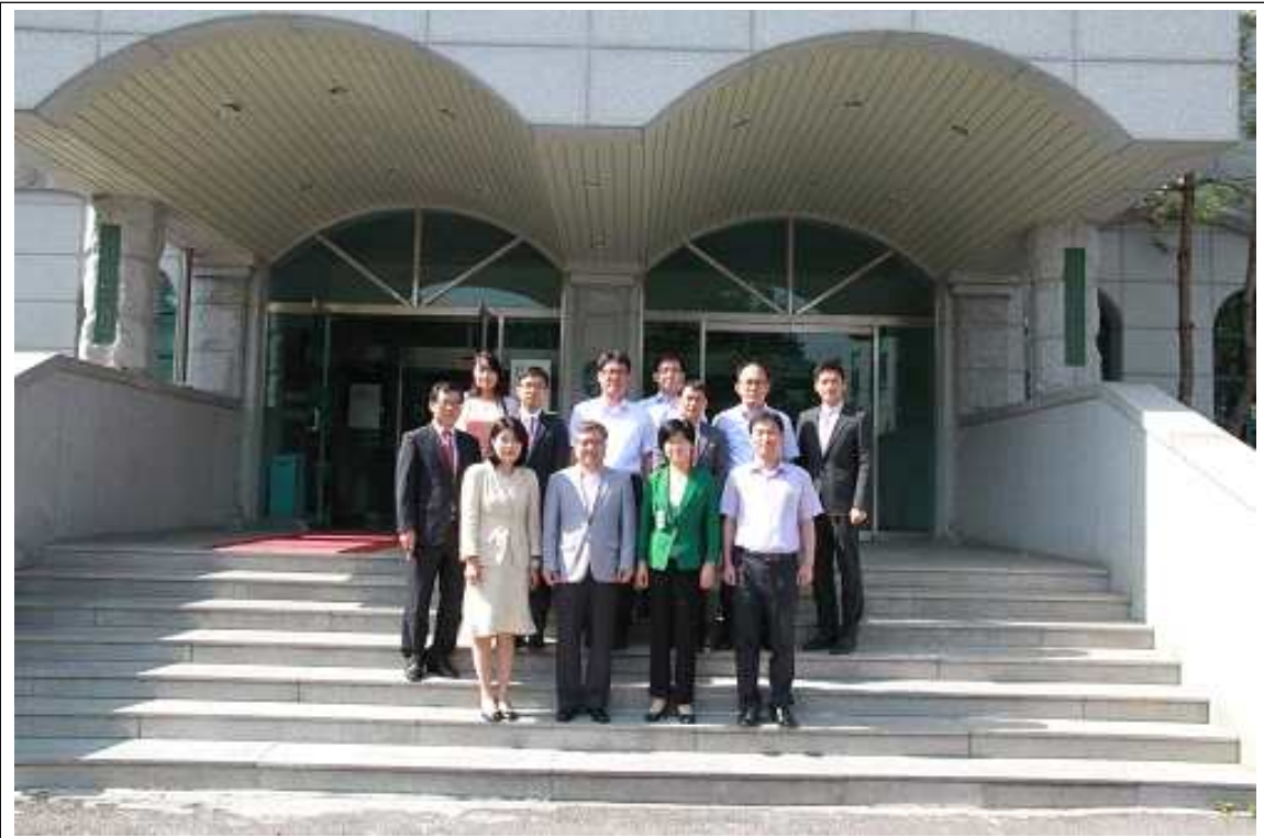
국방기관 업무평가 위원 현장방문 (2014.07.10.)