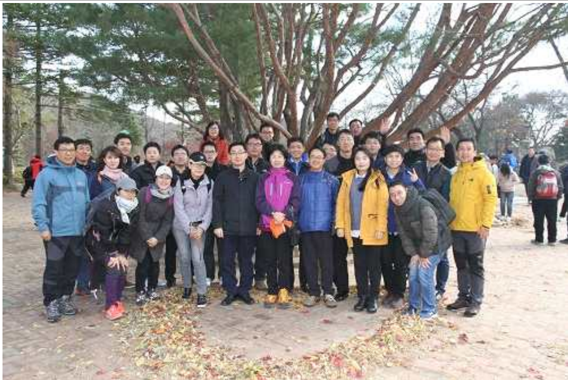
2014년 고등군사법원 워크숍 (2014.11.12.)