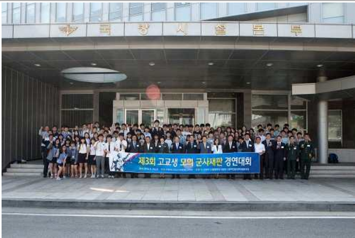
제3회 전국 고교생 모의 군사재판 경연대회 (2014.08.29.)