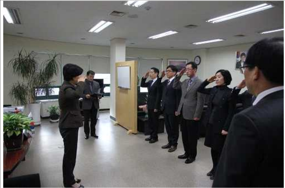
행정처 직원 보직변경 신고 (2014.01.06.)