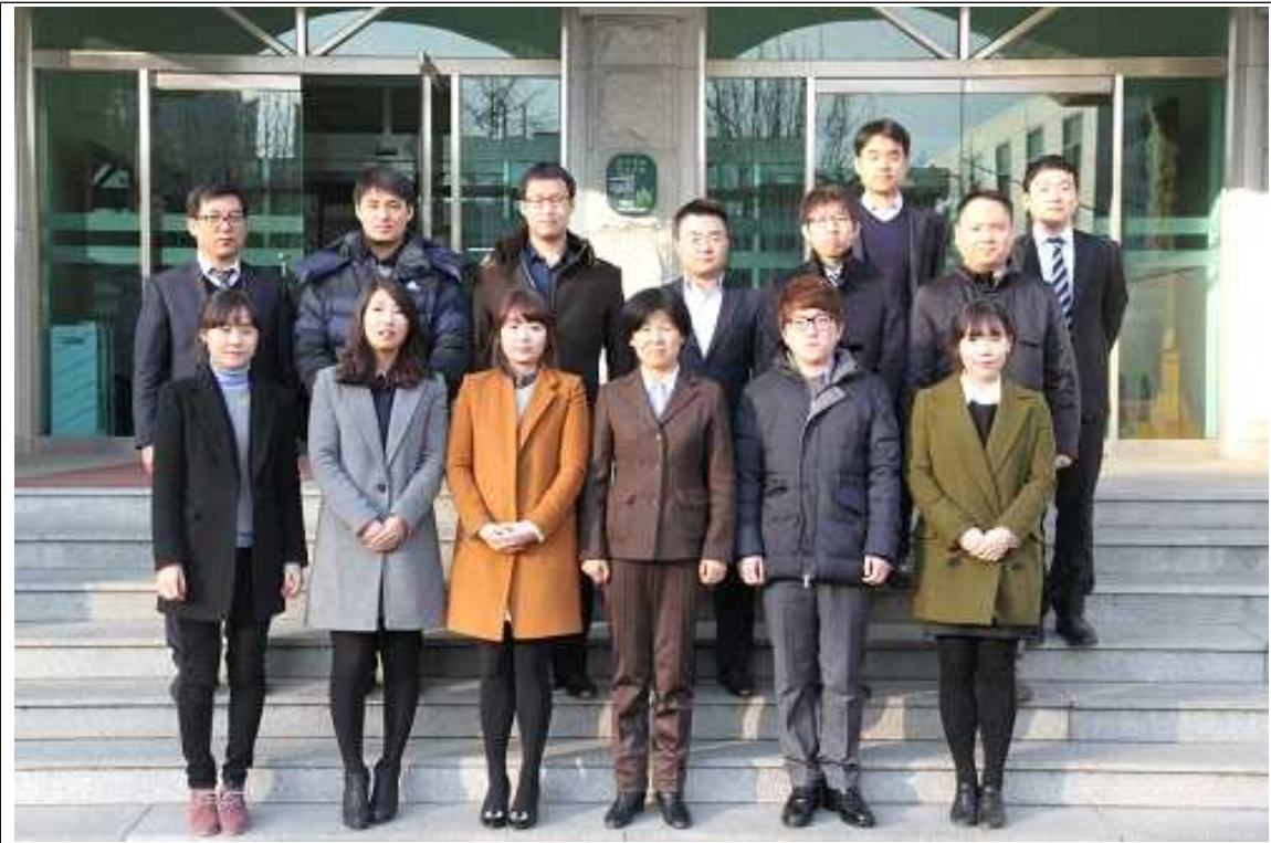
사법연수원생 실무수습 (2014.01.10.~01.14.)