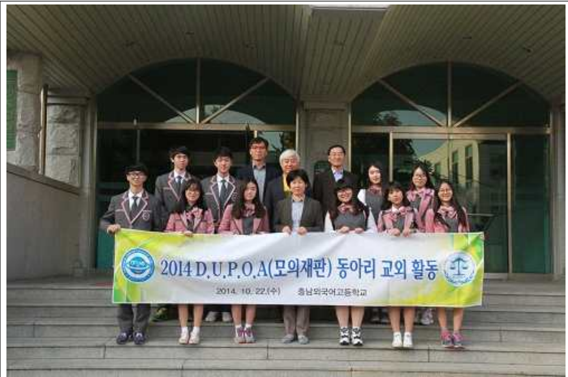
충남외고 법학동아리 법원 방문 (2014.10.22.)