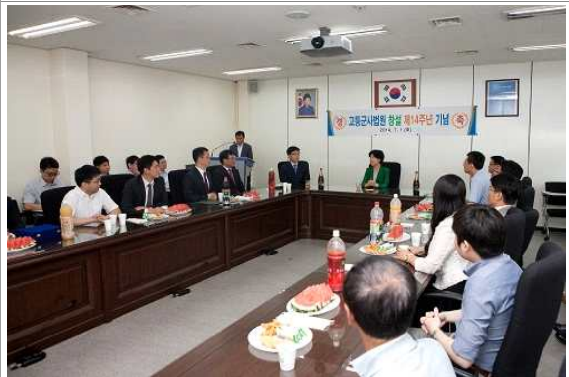
창설 제14주년 기념식 (2014.07.01.)