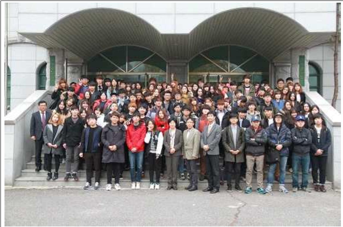
국민대학교 법학과 법원 방문 (2014.11.24.)