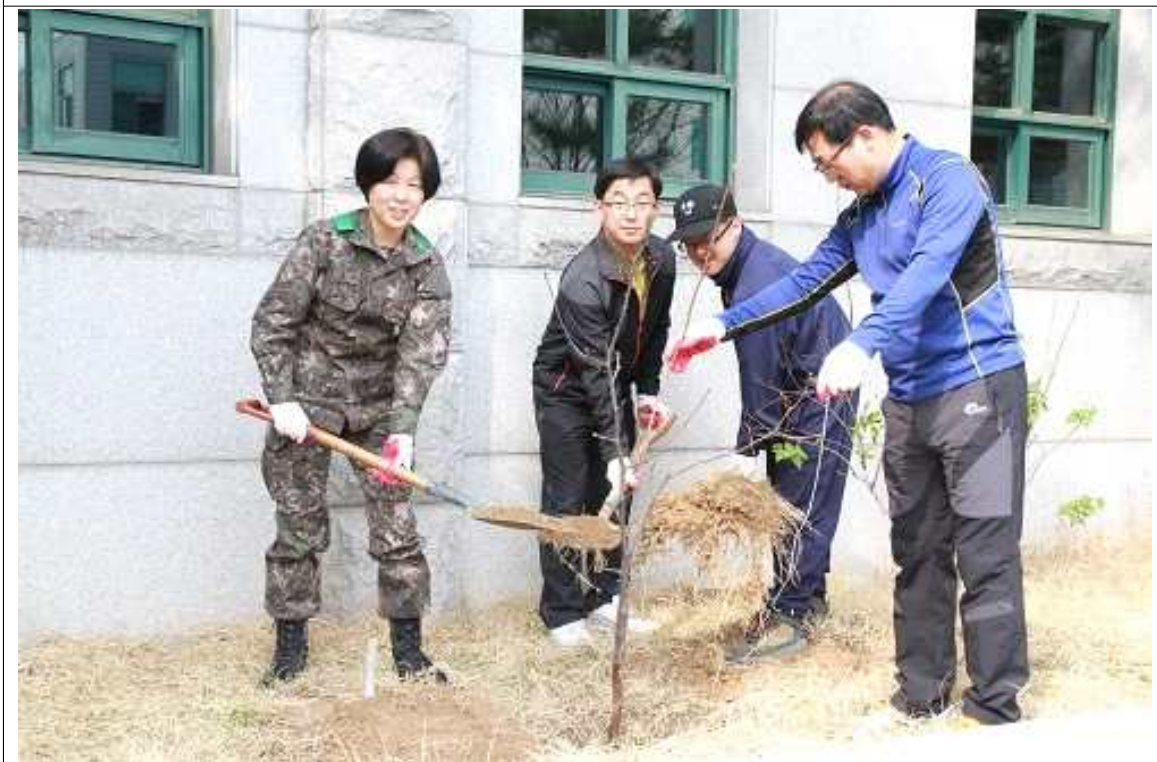
식목일 기념 식목행사 (2014.04.02.)