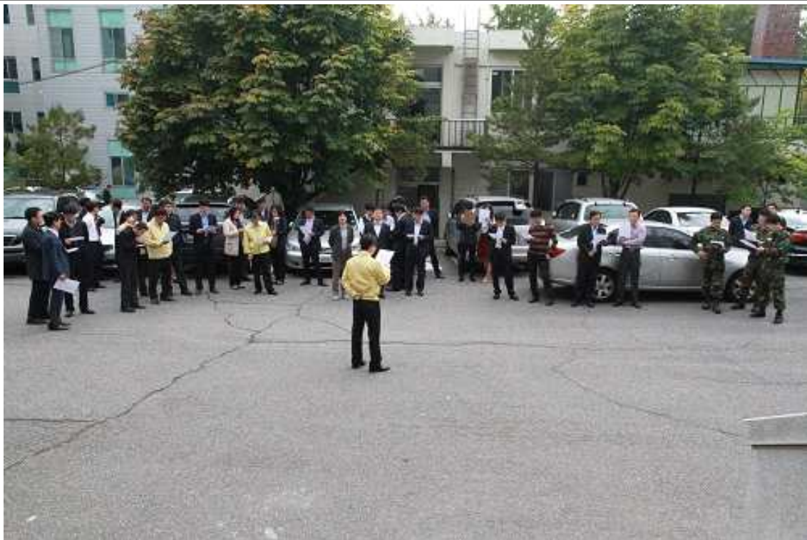
안전한국훈련기간 지진대피 훈련 (2014.10.22.)