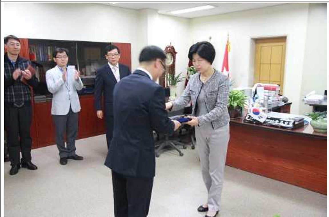
법의 날 기념 법무부장관 표창 수여식 (2014.04.25.)