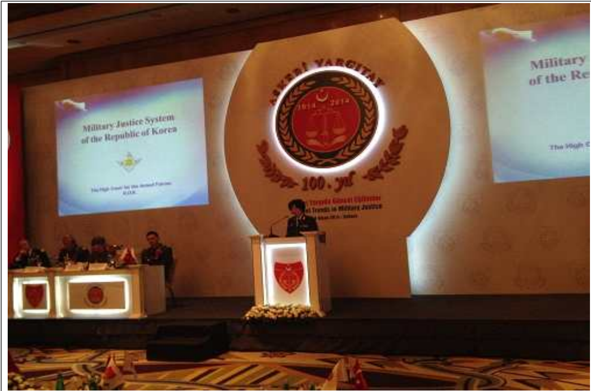
터키 국제군사법 심포지엄 공무출장 (2014.04.06.~04.11.)