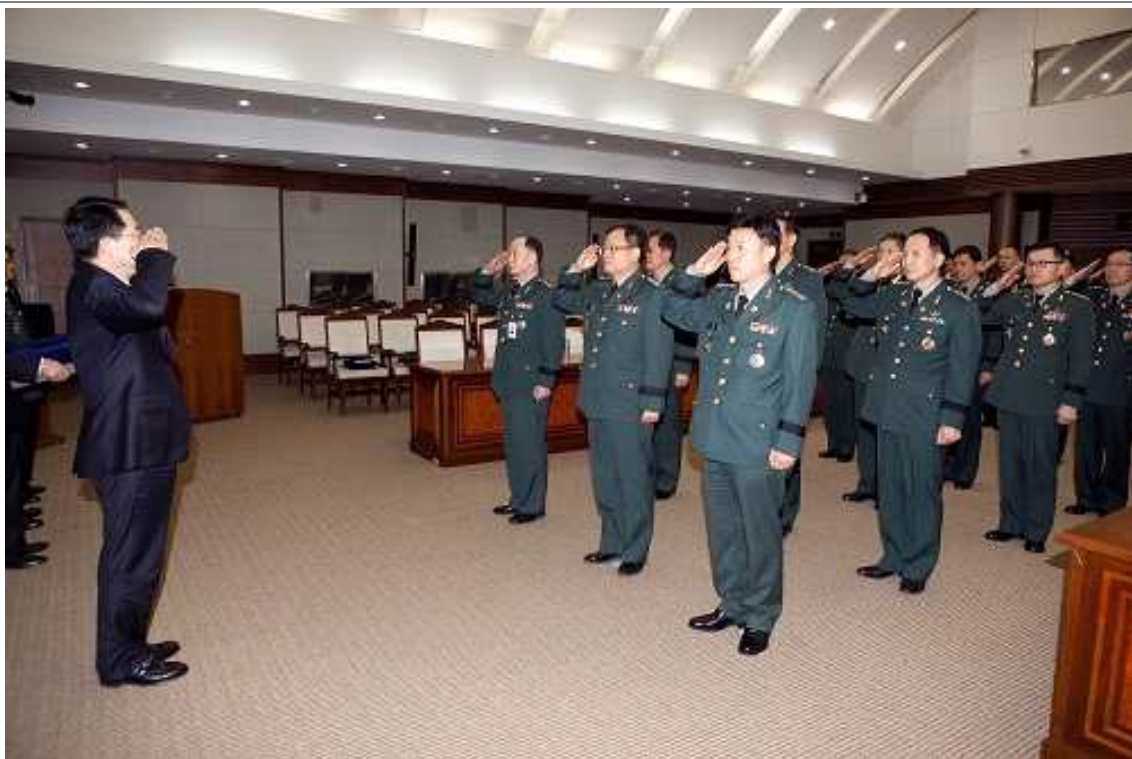
심판관 임명장 수여식 및 직무 교육 (2014.03.12.)