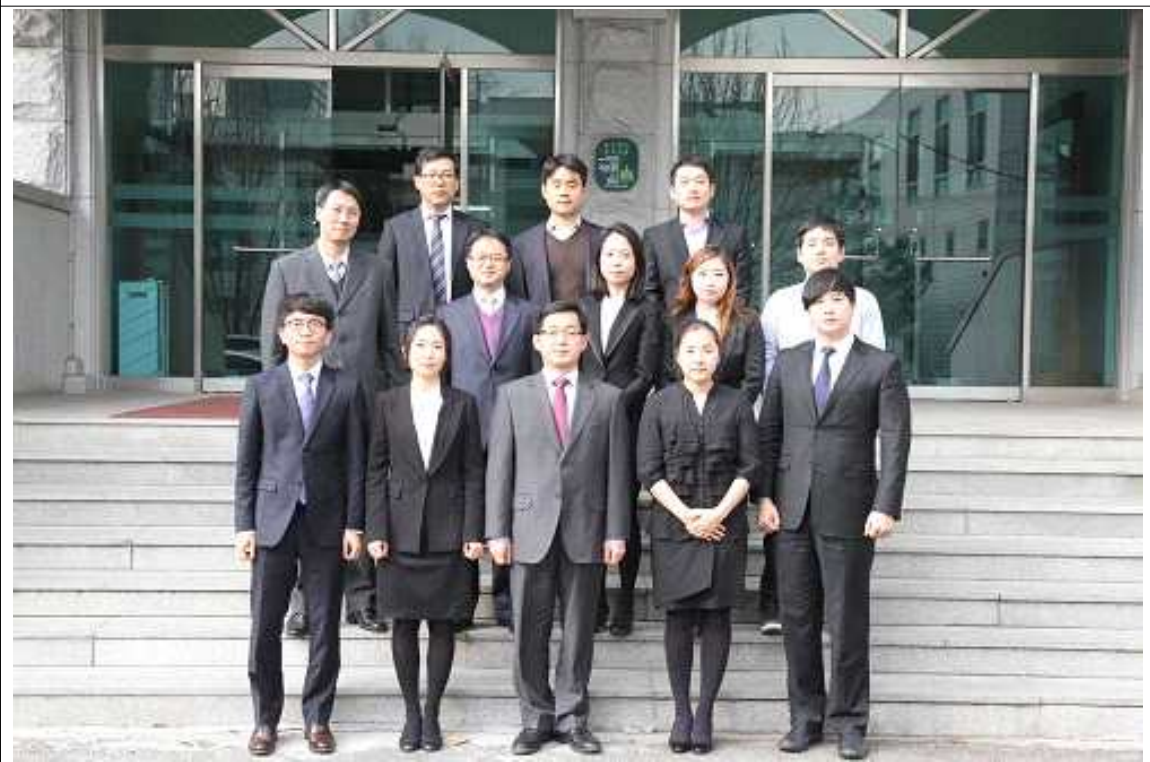
로스쿨생 실무수습 (2014.02.10.~02.12.)