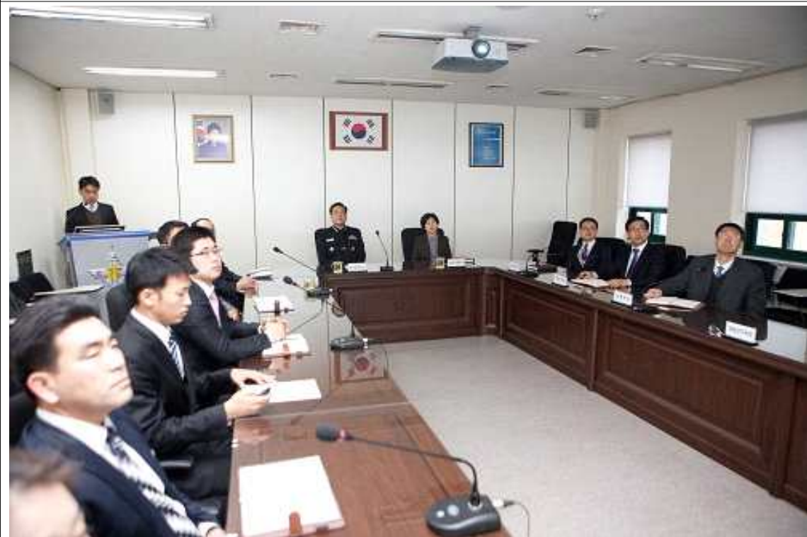
해군 참모총장 법원 방문 (2014.03.21.)