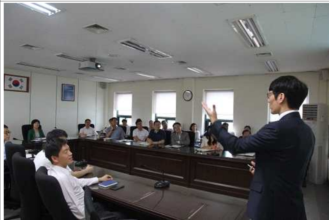
재무전문가 교양 교육 (2014.07.23.)