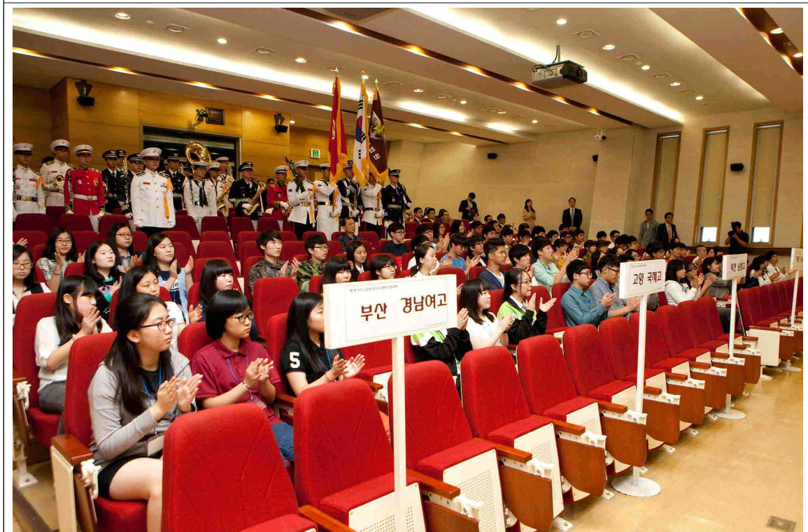
제2회 전국 고교생 모의 군사재판 경연대회 개회식 (2013.09.07.)