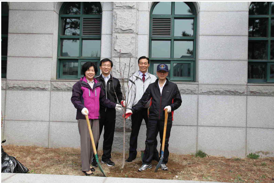
2013년 식목행사 (2013.04.05.)