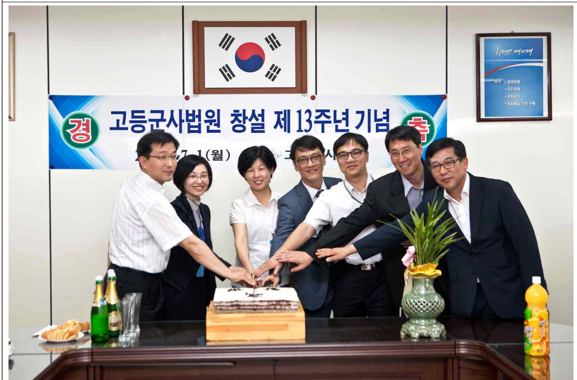
창설 13주년 기념 행사 (2013.07.01.)