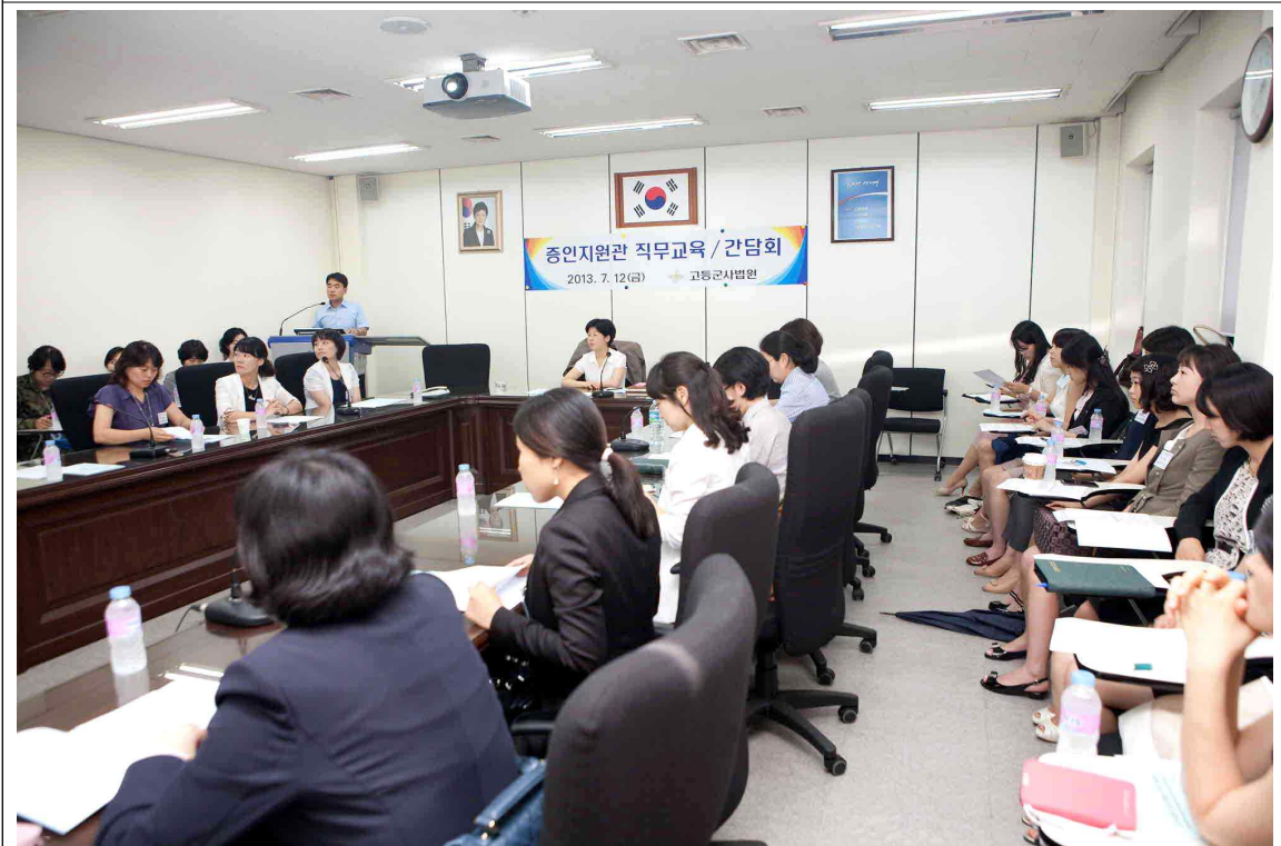
증인지원관 2차 직무교육 (2013.07.12.)