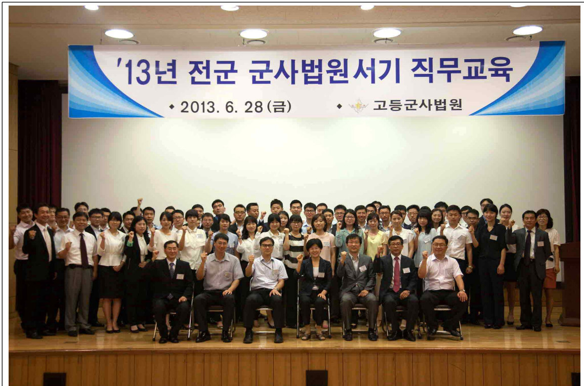
2013년 전군 군사법원서기 직무교육 (2013.06.28.)