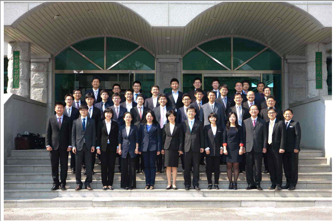
2013년 전군 군판사 직무교육 (2013.05.06.~05.08.)