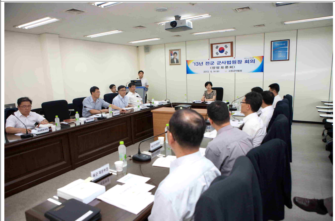
전반기 전군 군사법원장 회의 (2013.06.14.)