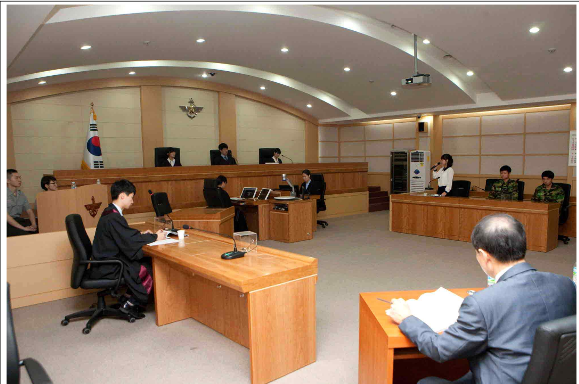
제2회 전국 고교생 모의 군사재판 경연대회 본선 (2013.09.07.)