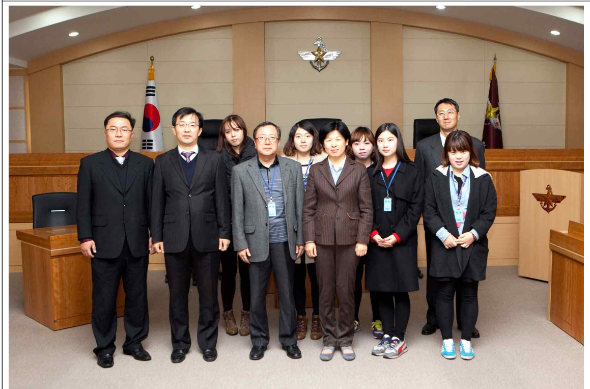
선문대학교 법학과 방문 (2013.11.22.)