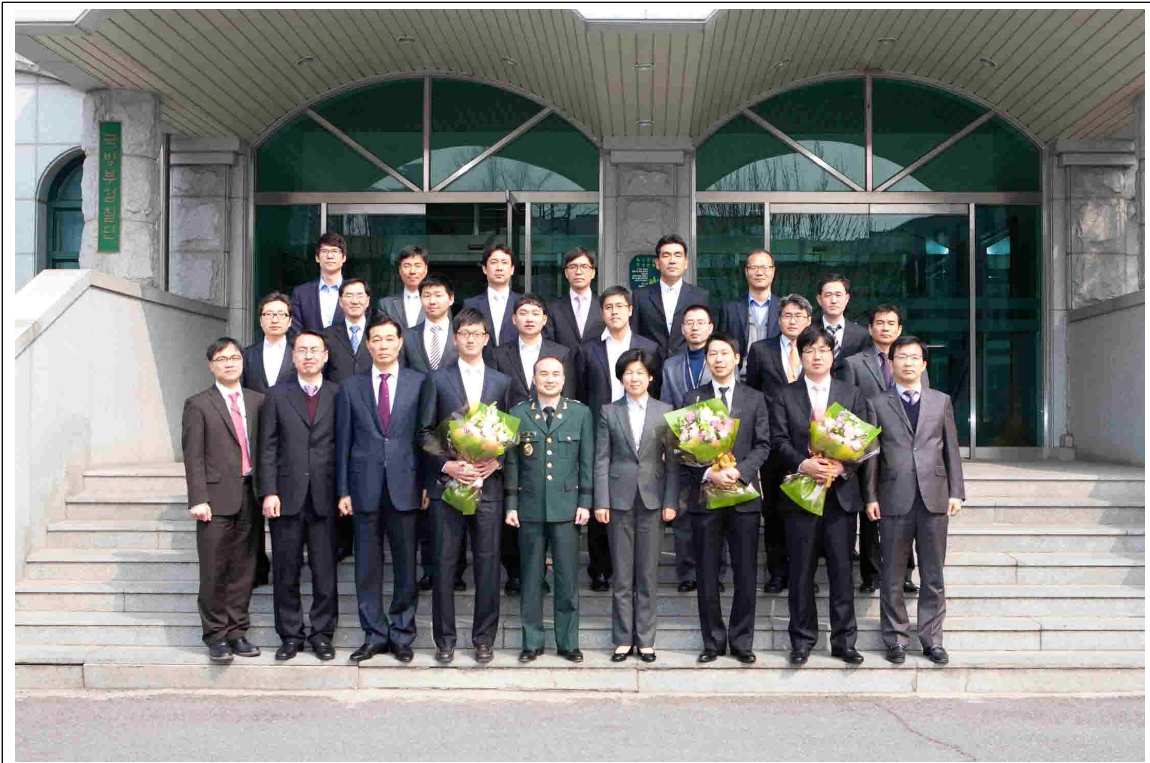
단기법무장교 전역식 (2013.03.28.)