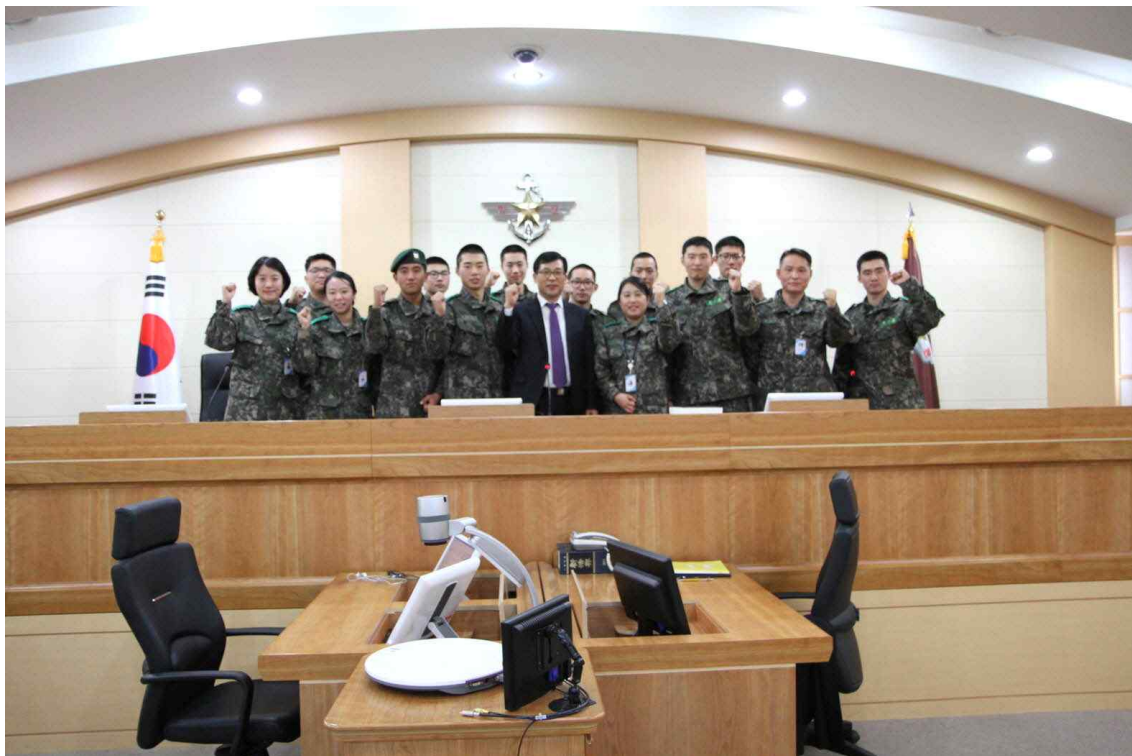
국군의무학교 교육단 방문 (2013.12.06.)