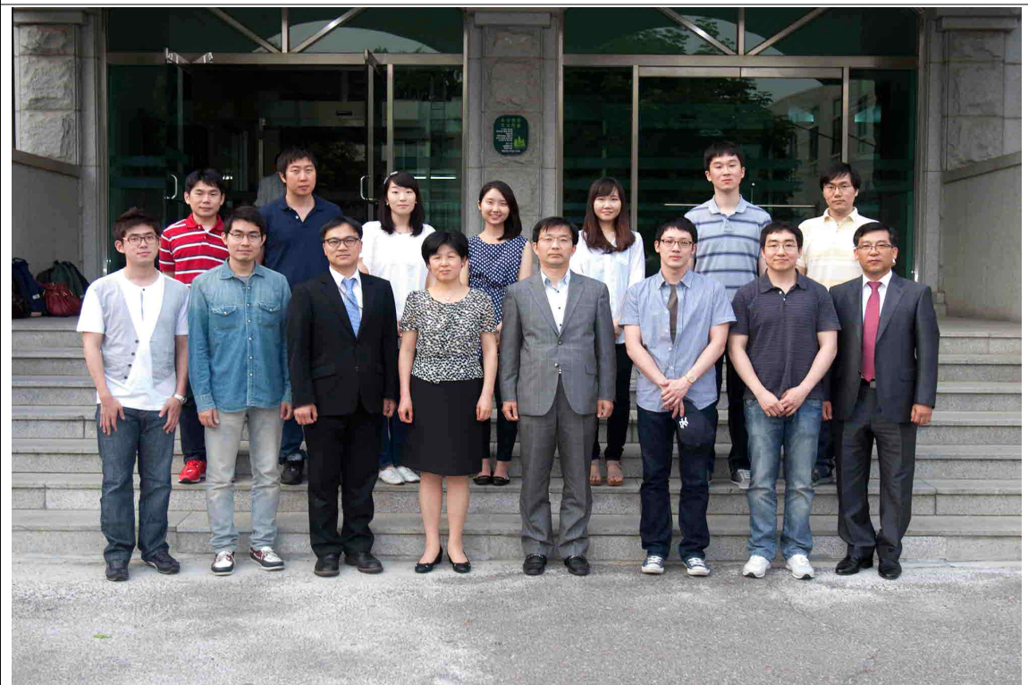
고려대 로스쿨생 고등군사법원 방문 (2013.05.24.)