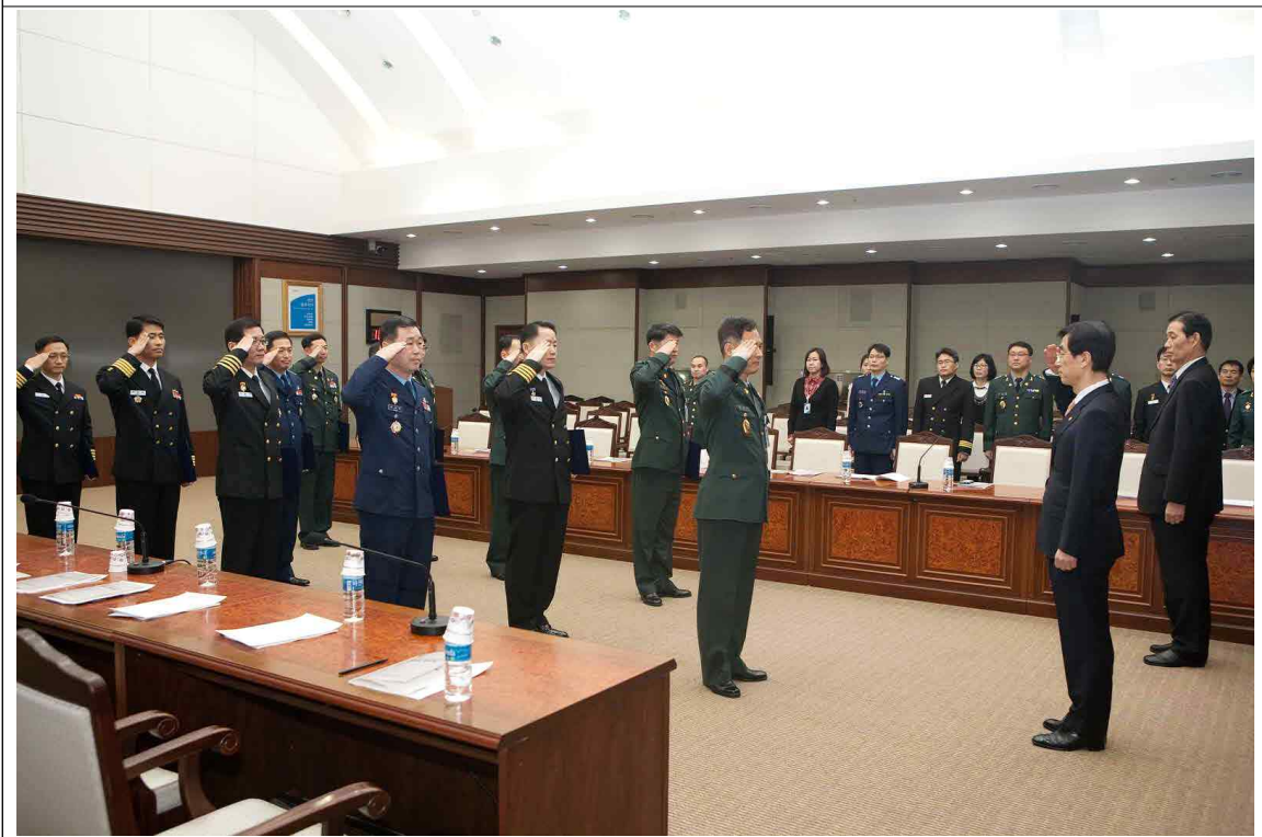
2013년 국방부 보통군사법원 심판관 임명장 수여식 (2013.02.18.)