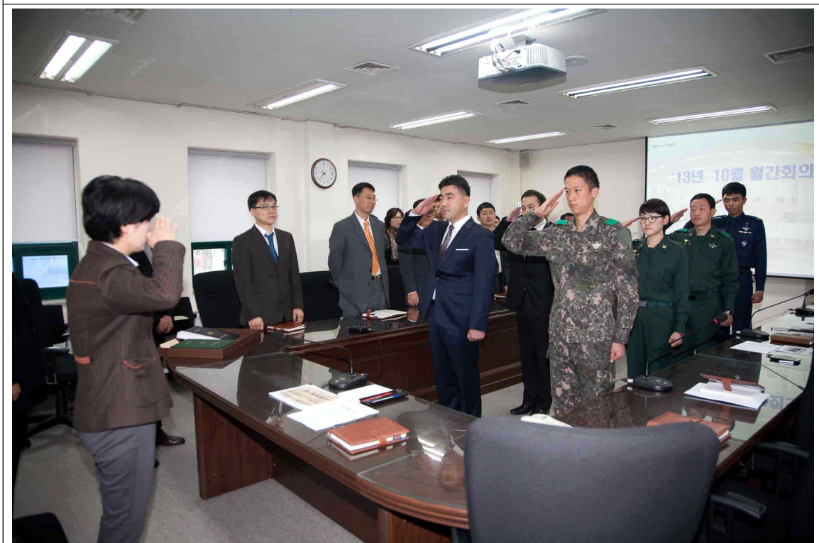
모의 군사재판 경연대회 유공자 표창 수여식 (2013.11.06.)