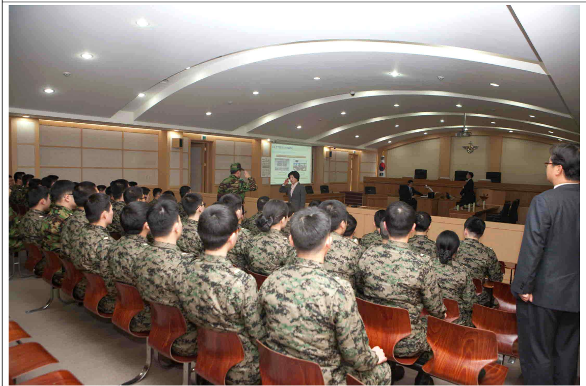
초당대 군사학과 학생 고등군사법원 법정 견학 (2013.03.25.)