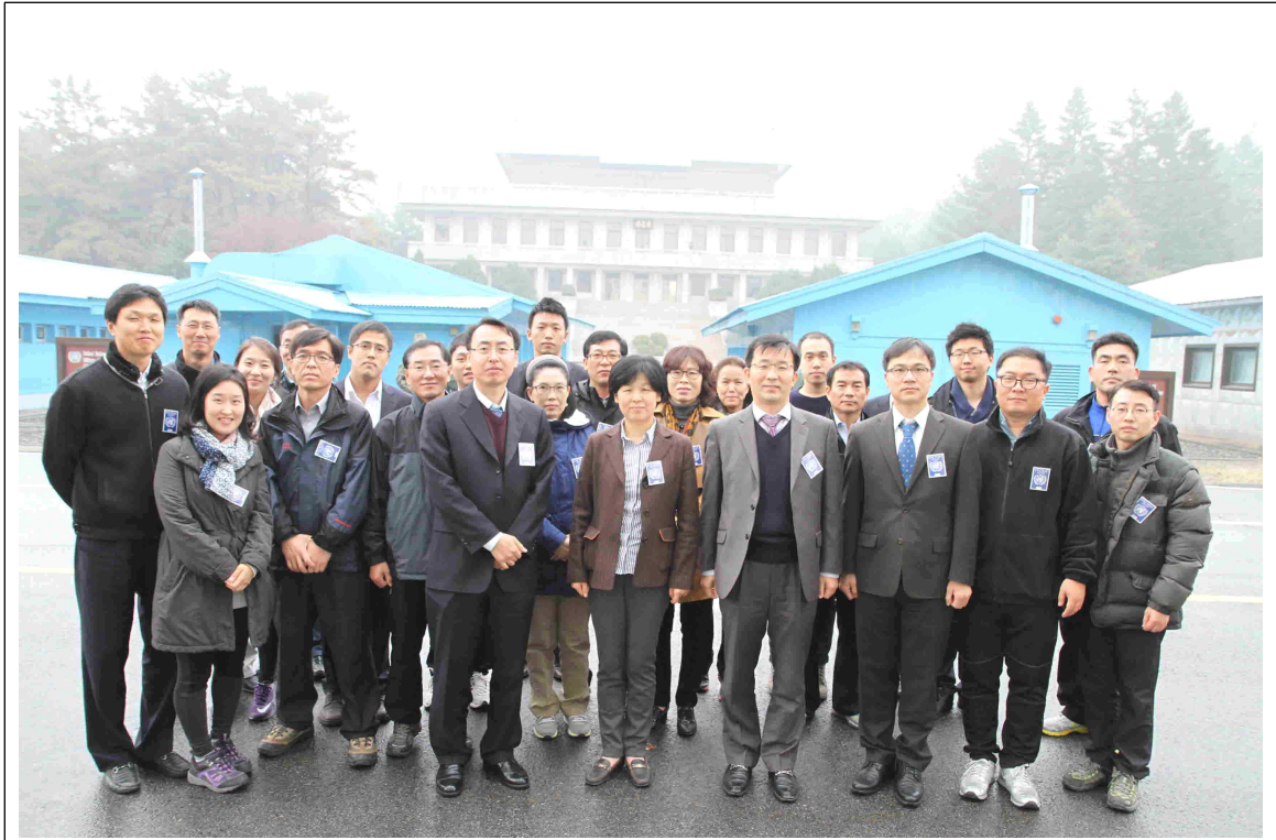
안보현장 견학 (2013.09.25.)