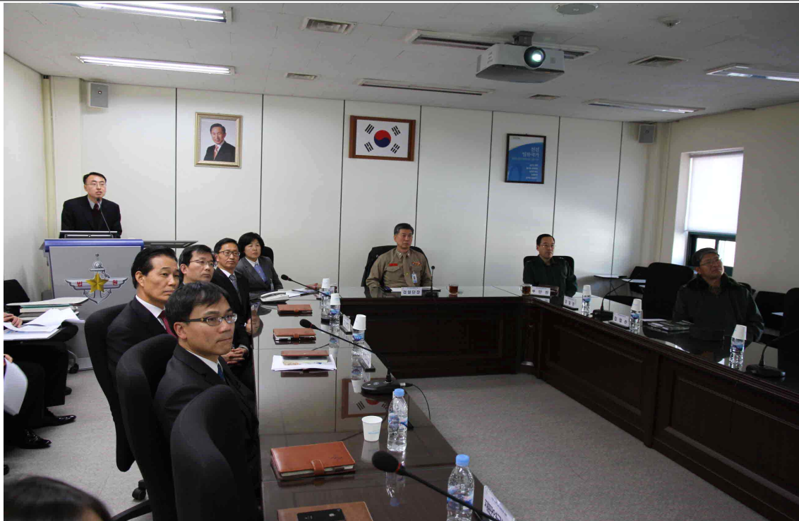
국방전비태세검열단장 법원 방문 (2013.01.09.)