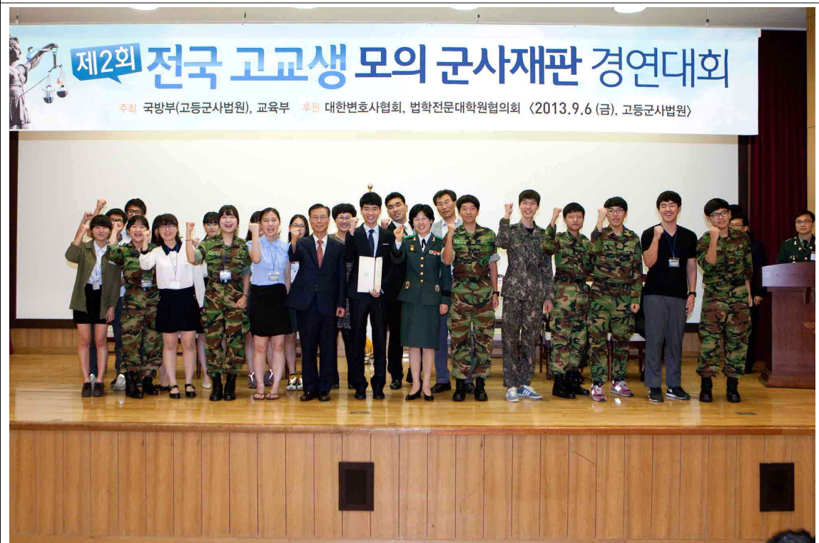
제2회 전국 고교생 모의 군사재판 경연대회 시상식 (2013.09.07.)