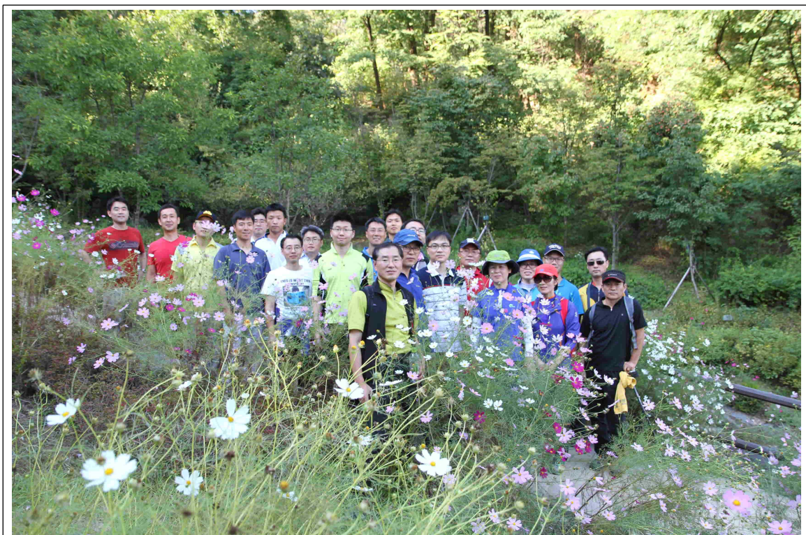
직원 단결행사 (2013.09.25.)