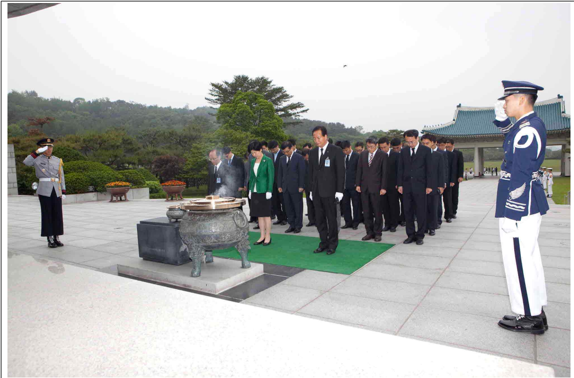
현충원 한송이 헌화 행사 (2013.05.29.)