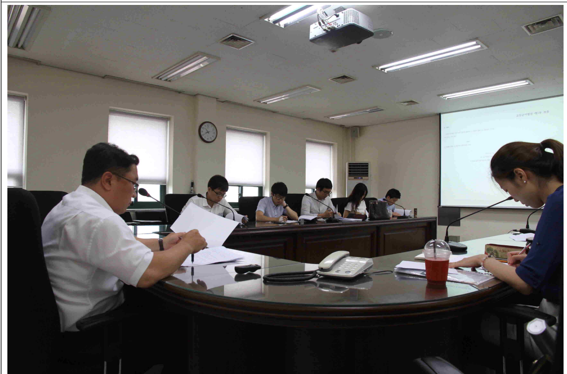
로스쿨생 실무수습 (2013.07.04.~07.05. / 07.08.~07.09.)