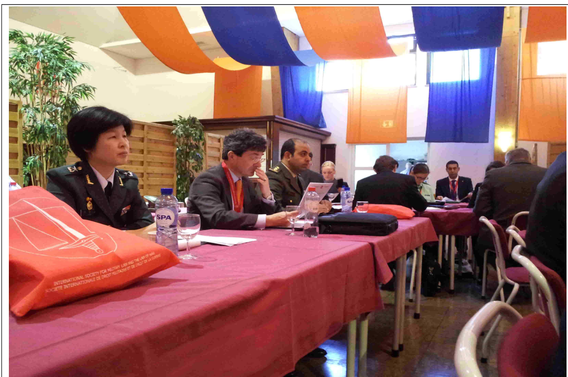
독일 뮌스터 국외출장[국제전쟁군사법학회 제9회 군법무관 세미나 (2013.04.08.~04.15.)