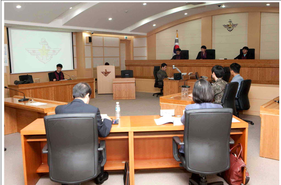
제2회 전국 고교생 모의 군사재판 경연대회 본선 (2013.09.07.)