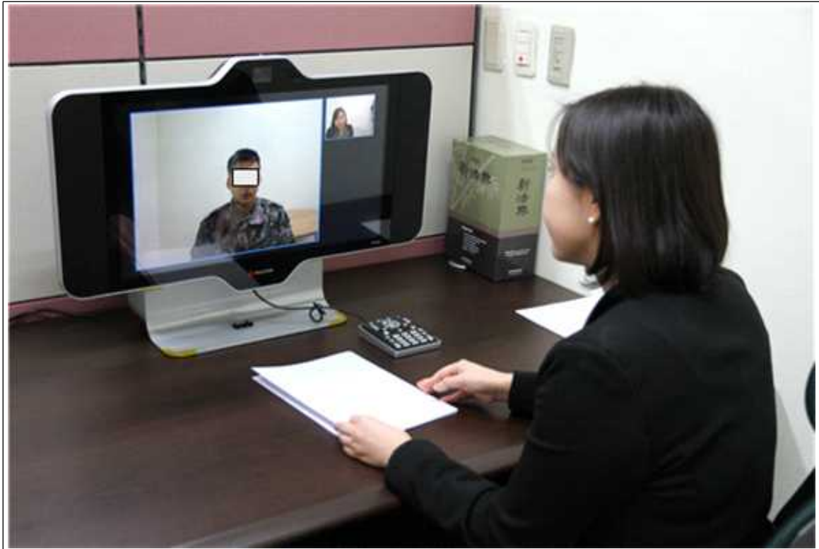
화상법률상담소 개소 (2013.02.19.)