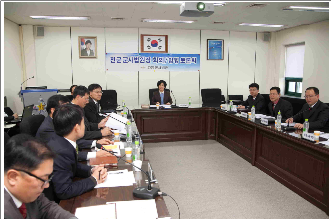
후반기 전군 군사법원장 회의 (2013.11.28.)