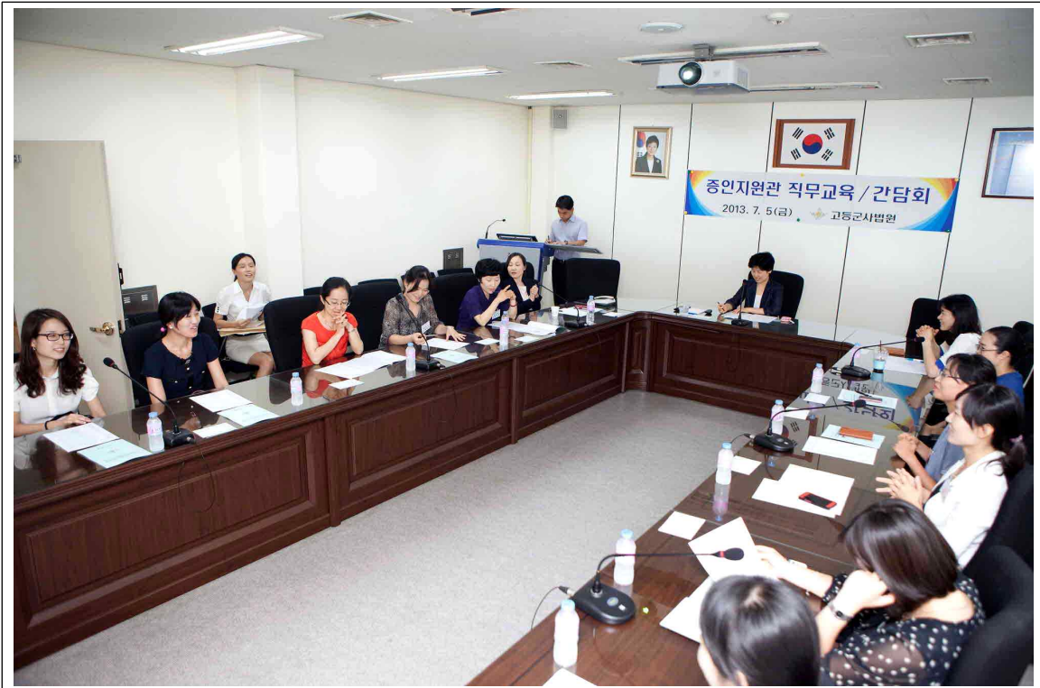
증인지원관 1차 직무교육 (2013.07.05.)