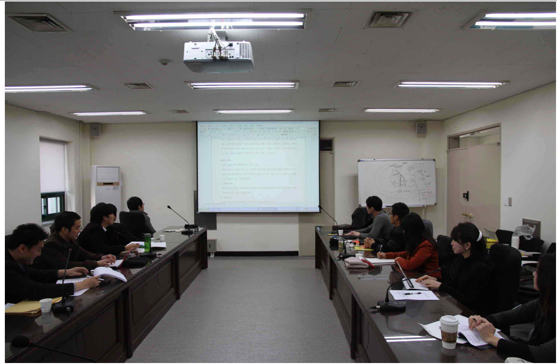
사법연수원 및 로스쿨생 실무수습 (2013.01.07.~01.11. / 01.14.~01.18.)