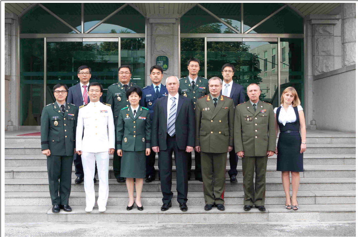
러시아 군검찰단장 방문 (2013.07.03.)