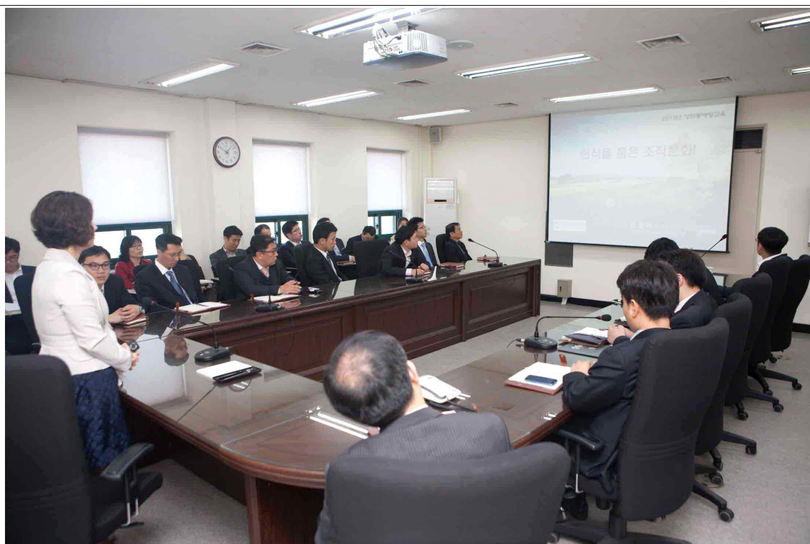
성인지력 향상 직원 교육 (2013.04.17.)