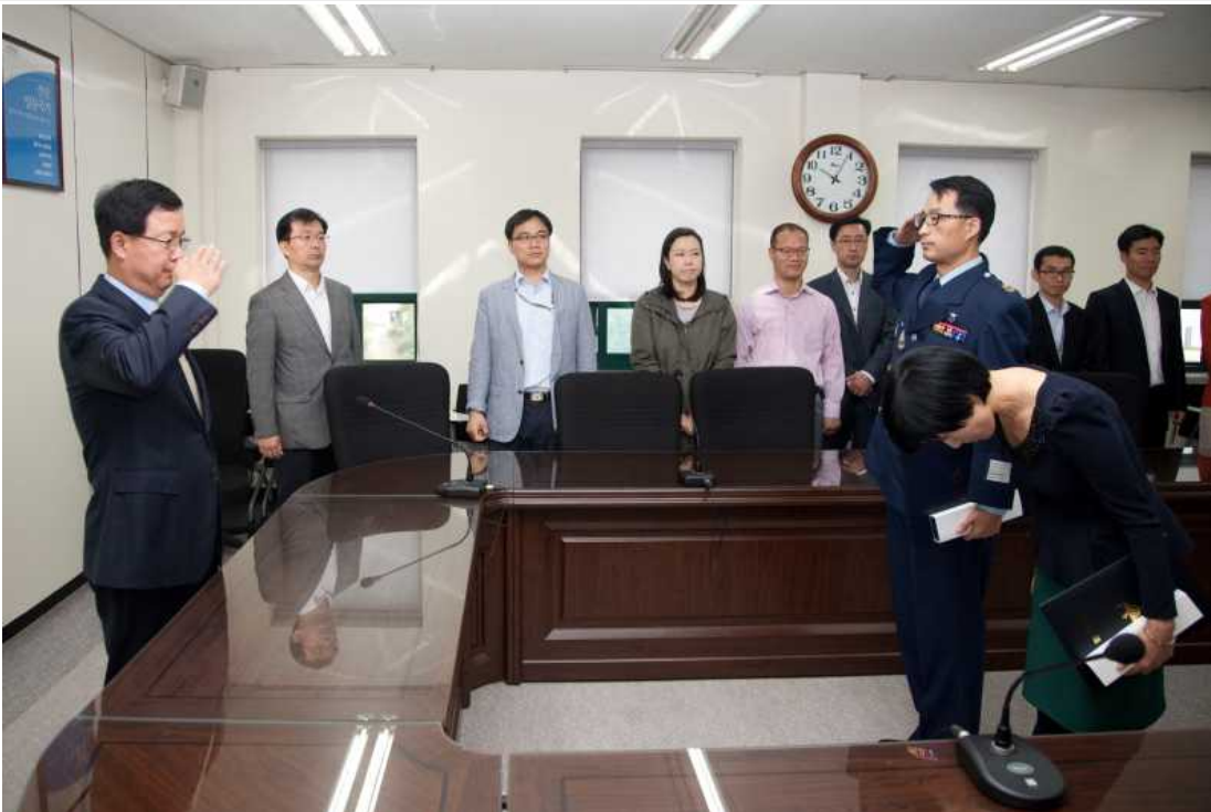
국군의 날 표창 수여식 (2012.9.28.)