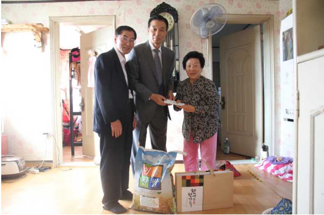
추석 명절 소년가장 위문 (2012.9.25.)