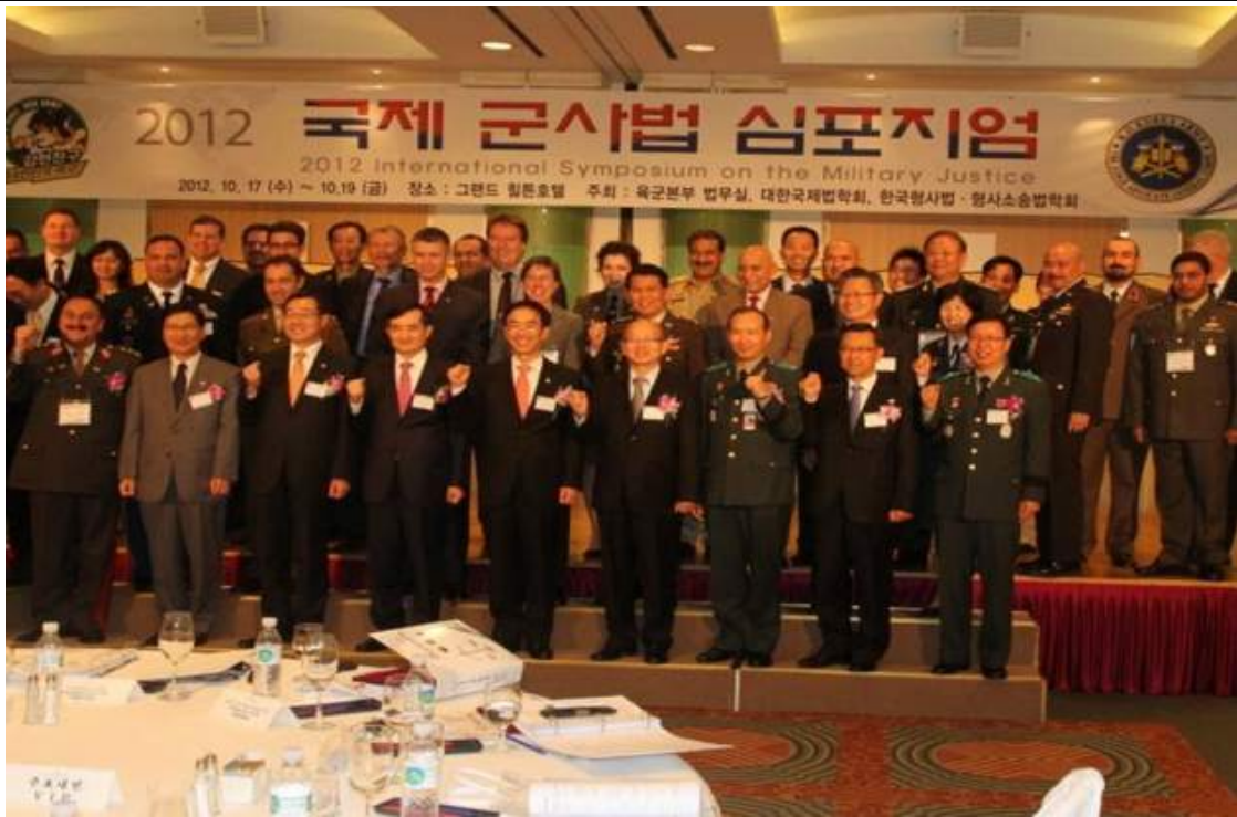
2012 국제 군사법 심포지엄 참석 (2012.10.17. ~ 10.19.)