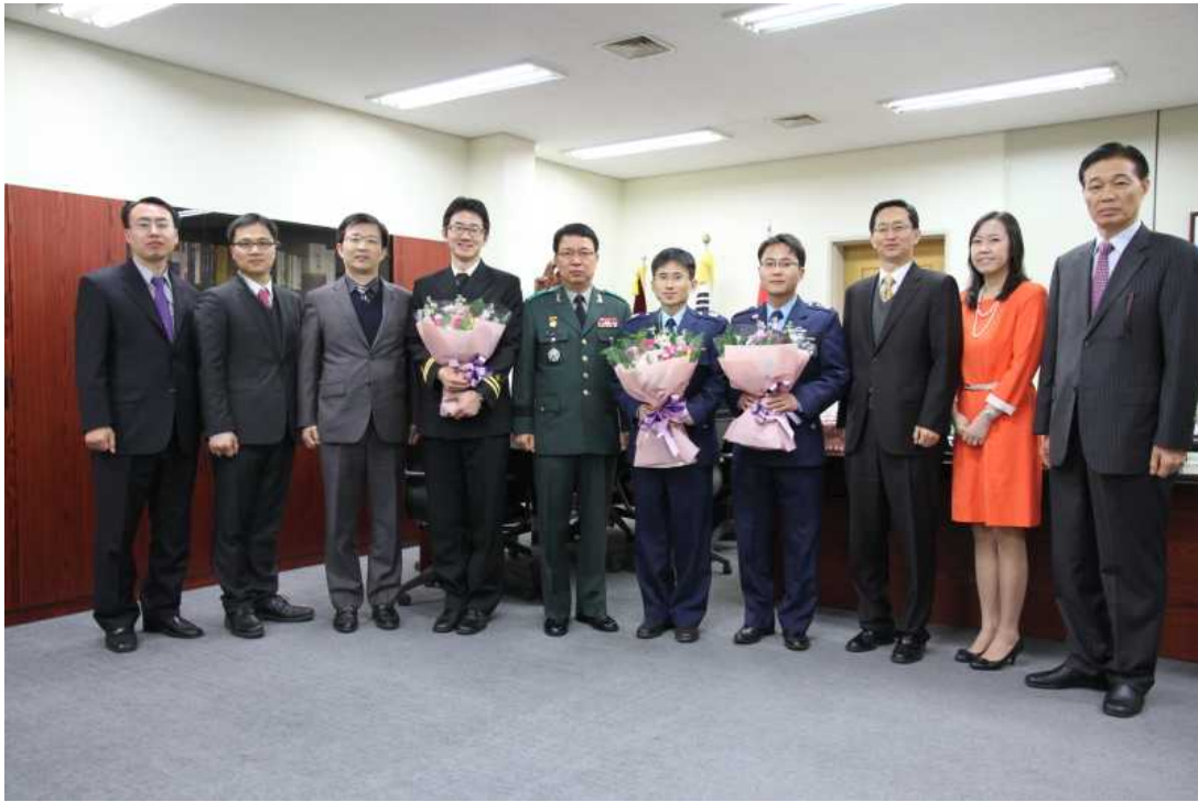
군법무관 전역 행사 (2012.3.30.)