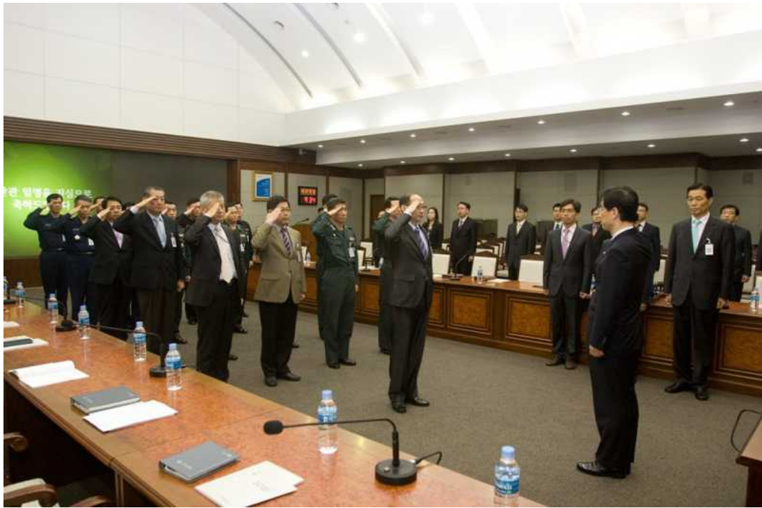
심판관 임명장 수여 및 직무교육 (2012.4.26.)