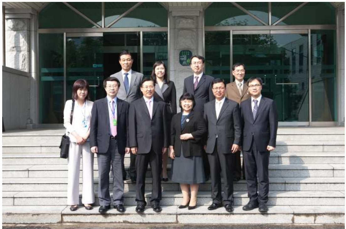
국방기관평가 위원 법원 방문 (2012.10.10.)