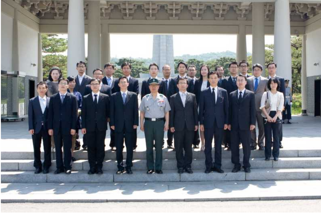
국립현충원 한송이 헌화 행사 참여 (2012.5.23.)