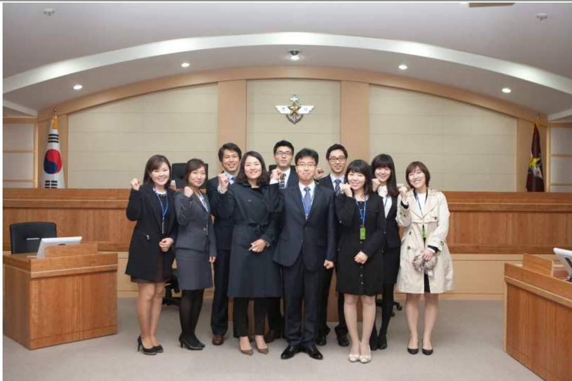
2012년 수습사무관 법원 방문 (2012.10.31.)