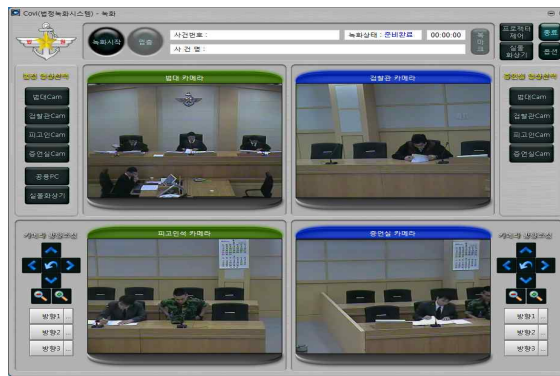
증인화상신문시스템 및 화상법률상담시스템 구축 (2012.12.14. ~ 12.26.)