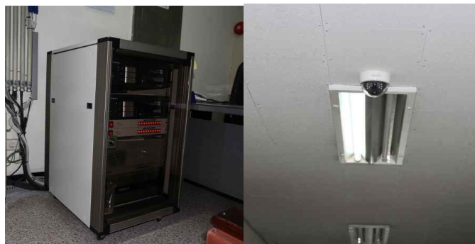
CCTV 교체 사업 추진 (2012.12.17. ~ 12.21.)