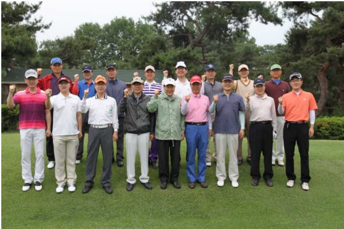
역대 군사법원장 / 검찰단장 초청 행사 (2012.5.30.)