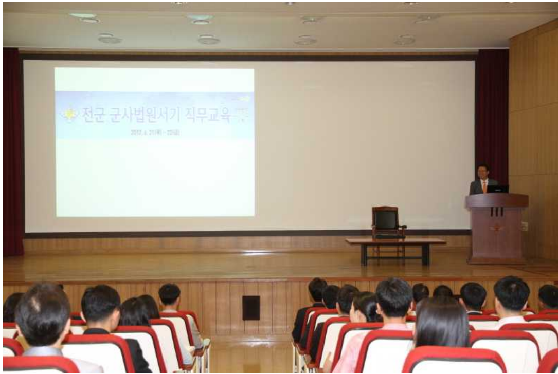
전군 군사법원서기 직무 교육 (2012.6.21. ~ 6.22.)