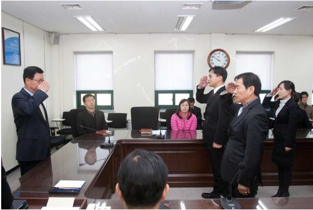
모의재판 유공자 등 표창 수여식(2012.11.14.)