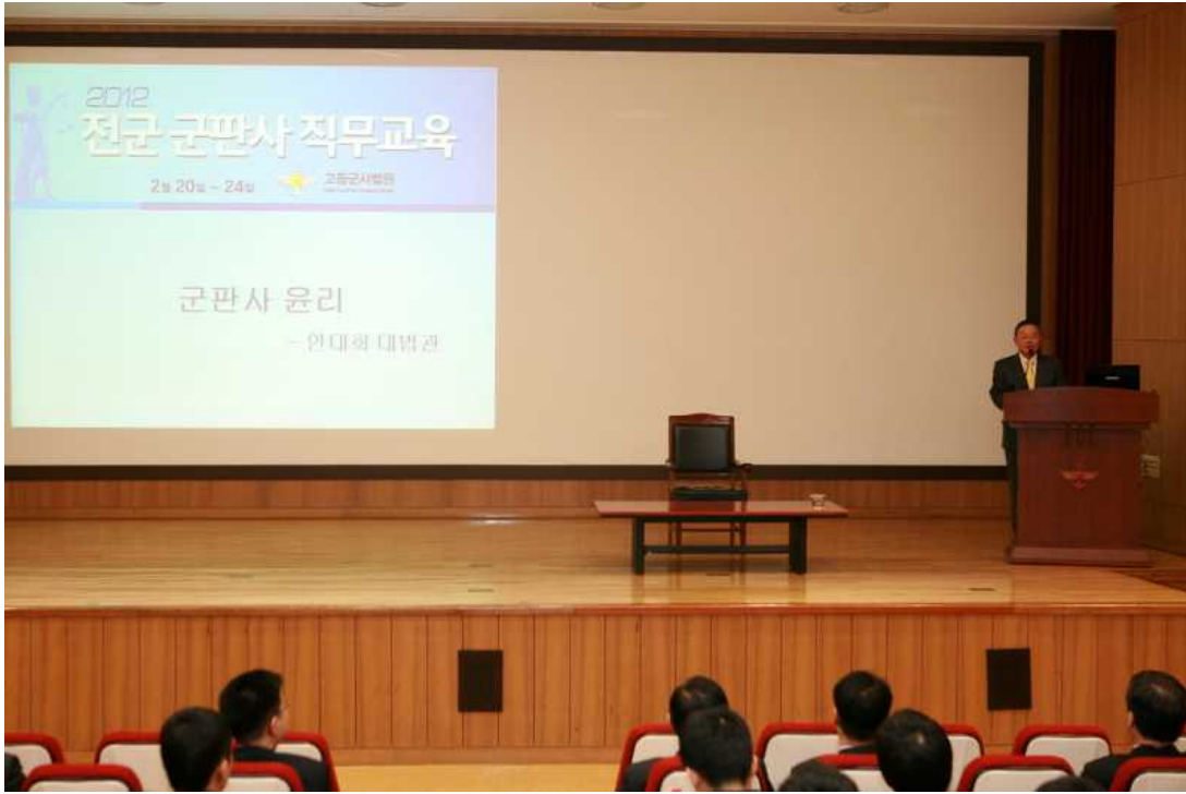
전국 군판사 직무교육 (2012.2.20. ~ 2.24.)