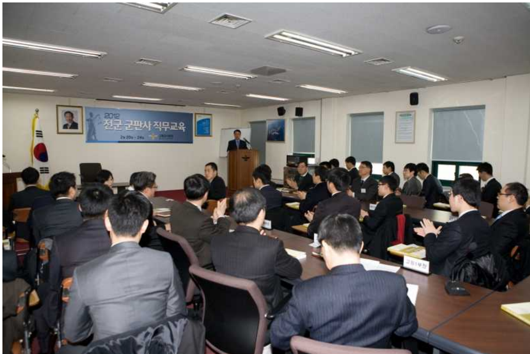
전국 군판사 직무교육 (2012.2.20. ~ 2.24.)