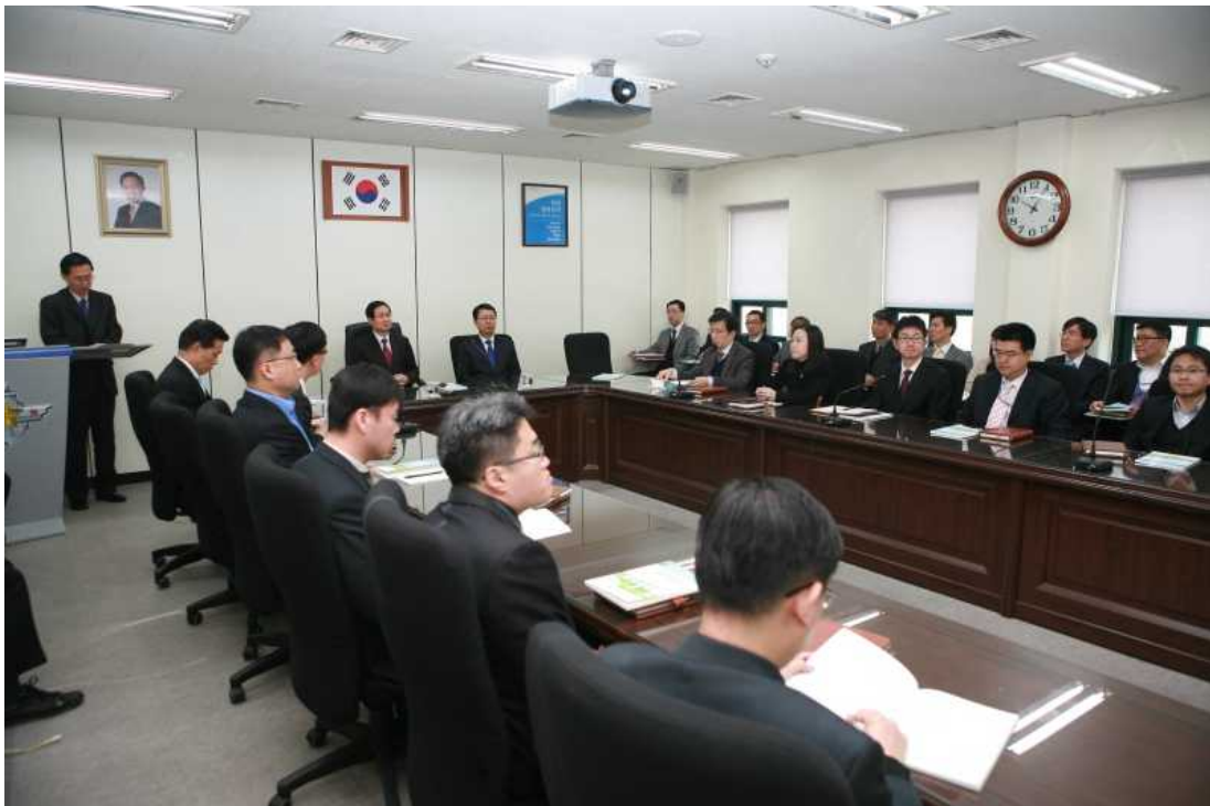
외부강사초빙 [중앙선거관리위원회 김용희 선거실장] (2012.3.7.)