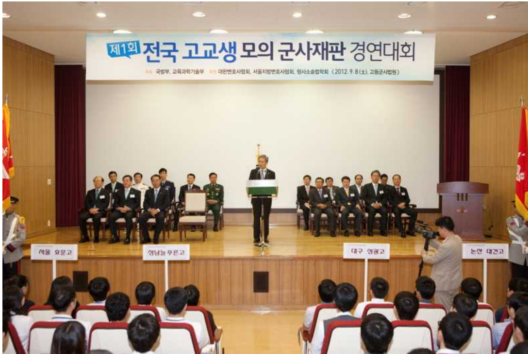
제1회 전국 고교생 모의 군사재판 경연 대회 개최 (2012.9.8.)