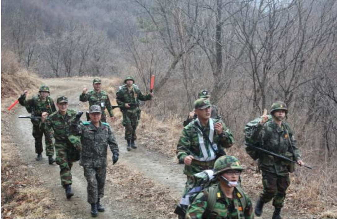
법무사관후보생 유격입소 행군 동참 (2012.3.3.)