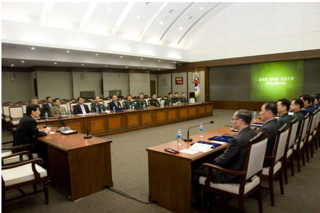
심판관 임명장 수여 및 직무교육 (2012.4.26.)