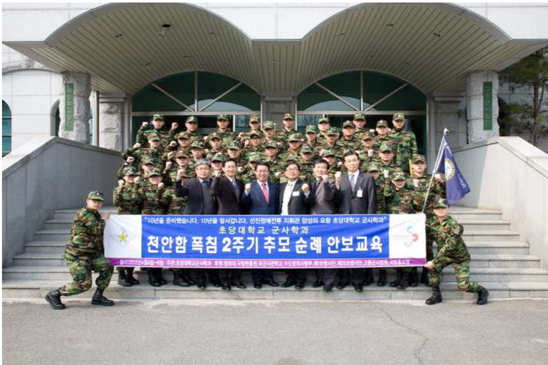
초당대 군사학과 학생 법정 견학 (2012.4.4.)