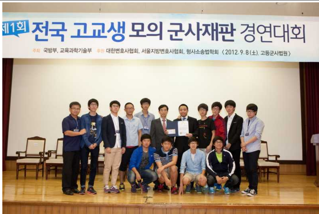
제1회 전국 고교생 모의 군사재판 경연 대회 개최 (2012.9.8.)