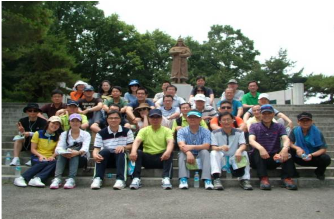
창설 제12주년 기념 행사(2012.6.29.)