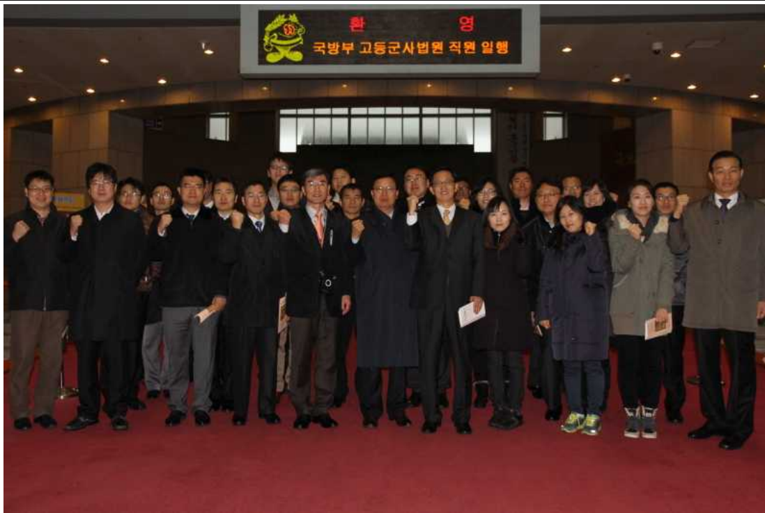
2012년 군사법 발전방향 워크숍 및 안보견학 (2012.12.7.)