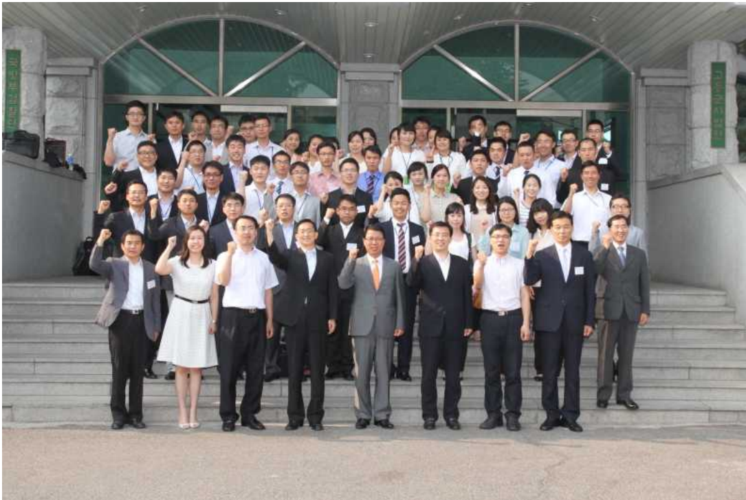
전군 군사법원서기 직무 교육 (2012.6.21. ~ 6.22.)