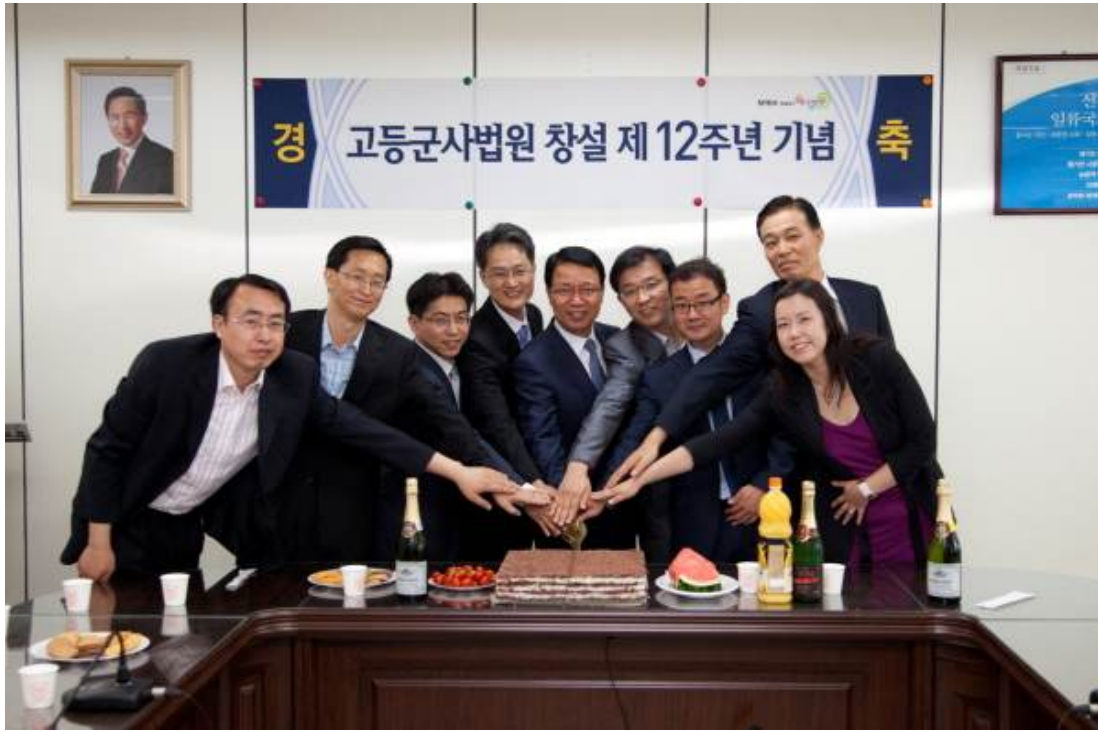
창설 제12주년 기념 행사(2012.6.29.)