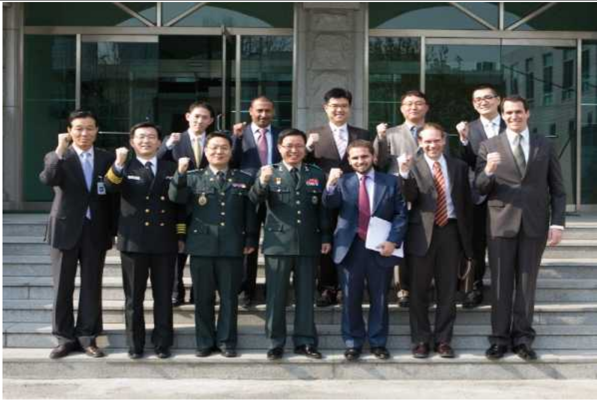
요르단 왕자 고등군사법원 방문 (2011.4.14.)