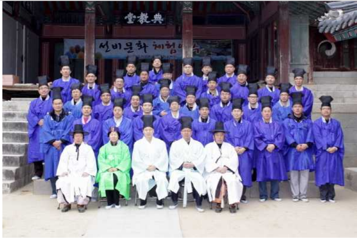
도산서원 선비문화 체험 (2011.2.10.)