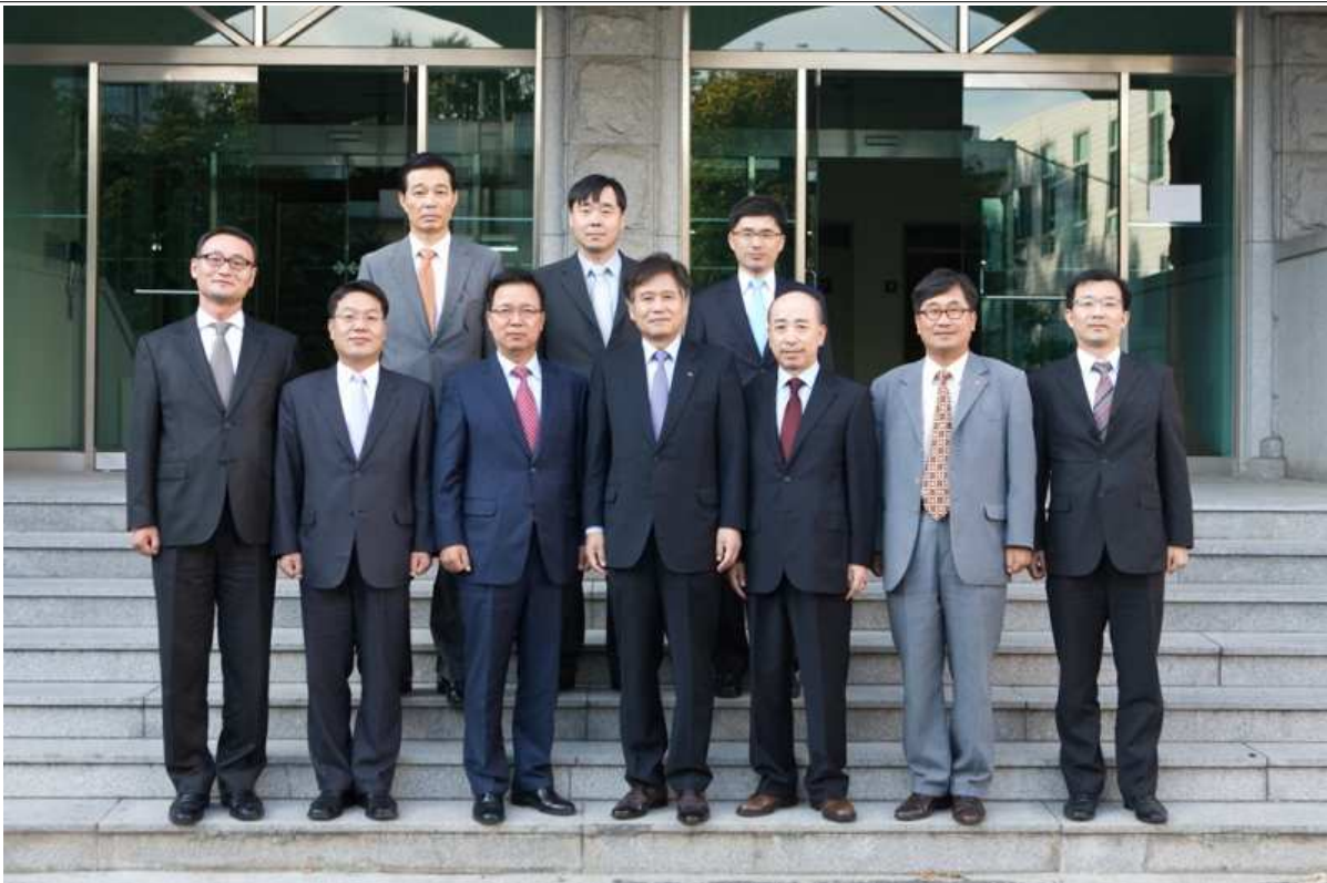
초당대 총장 고등군사법원 방문 (2011.9.30.)