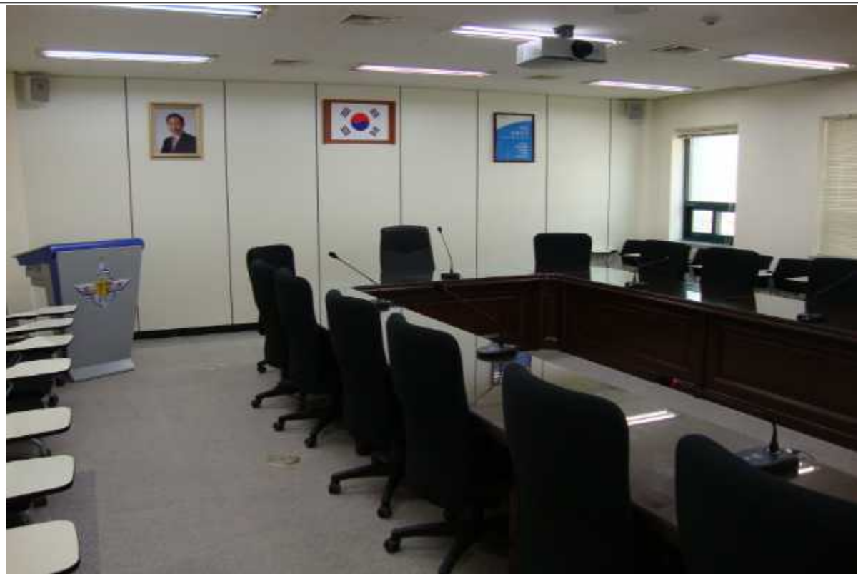
고등군사법원 회의실 현대화 (2011.2.14.)