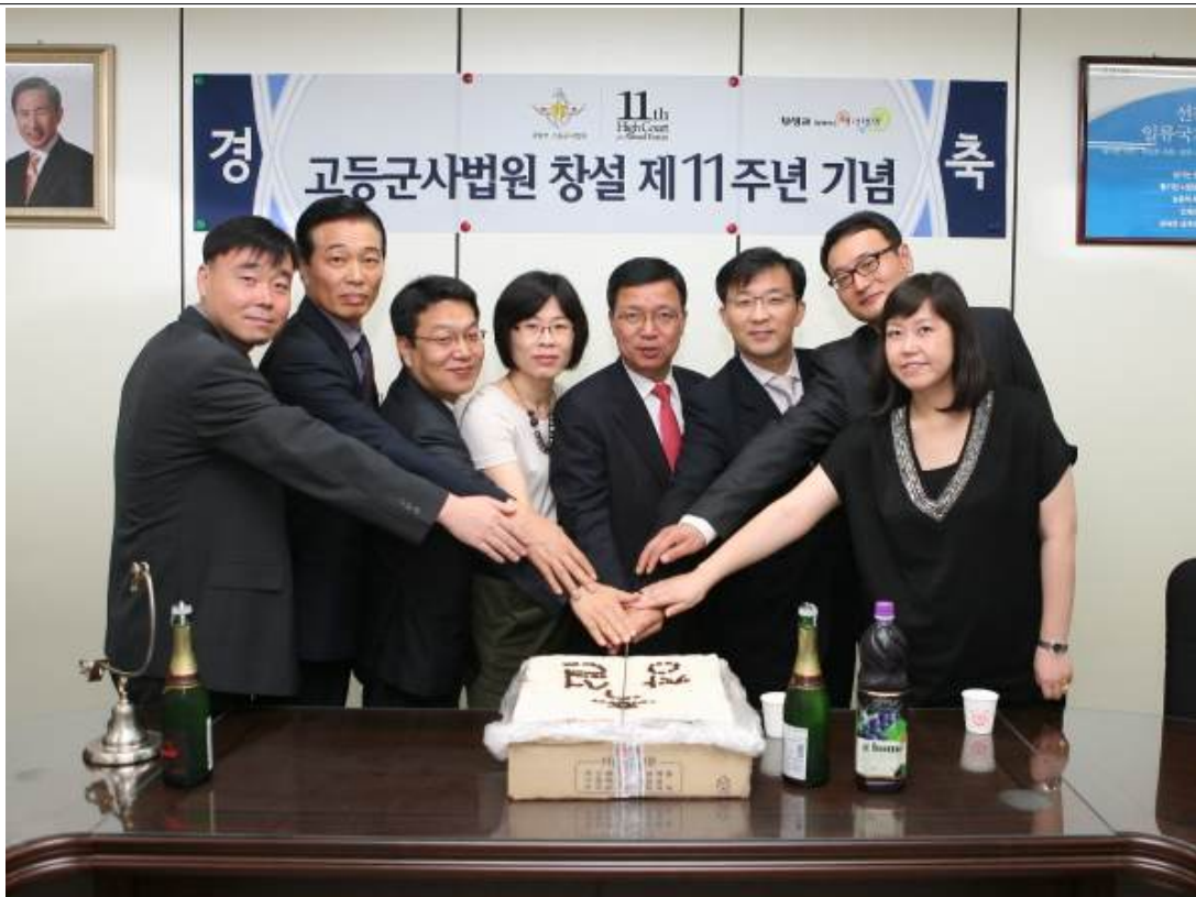
창설 제11주년 기념 행사 (2011.7.1.)