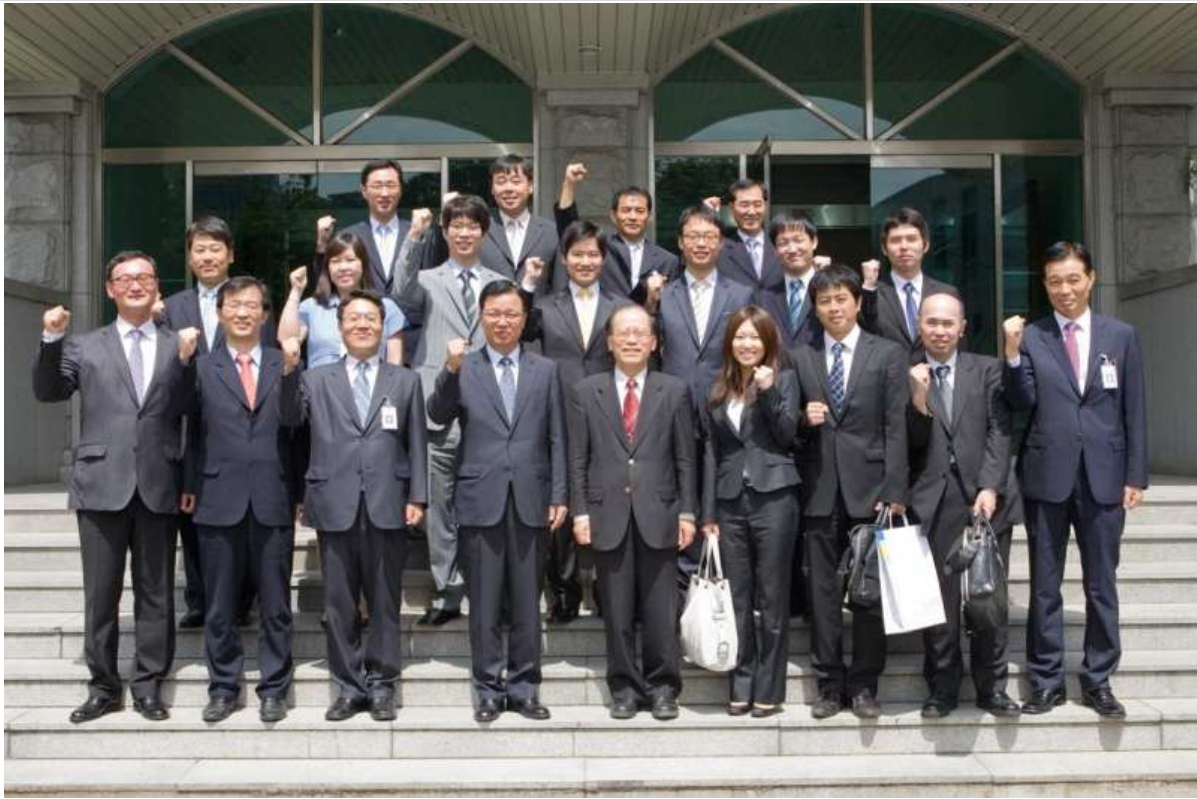
일본 로스쿨생 고등군사법원 방문 (2011.8.26.)