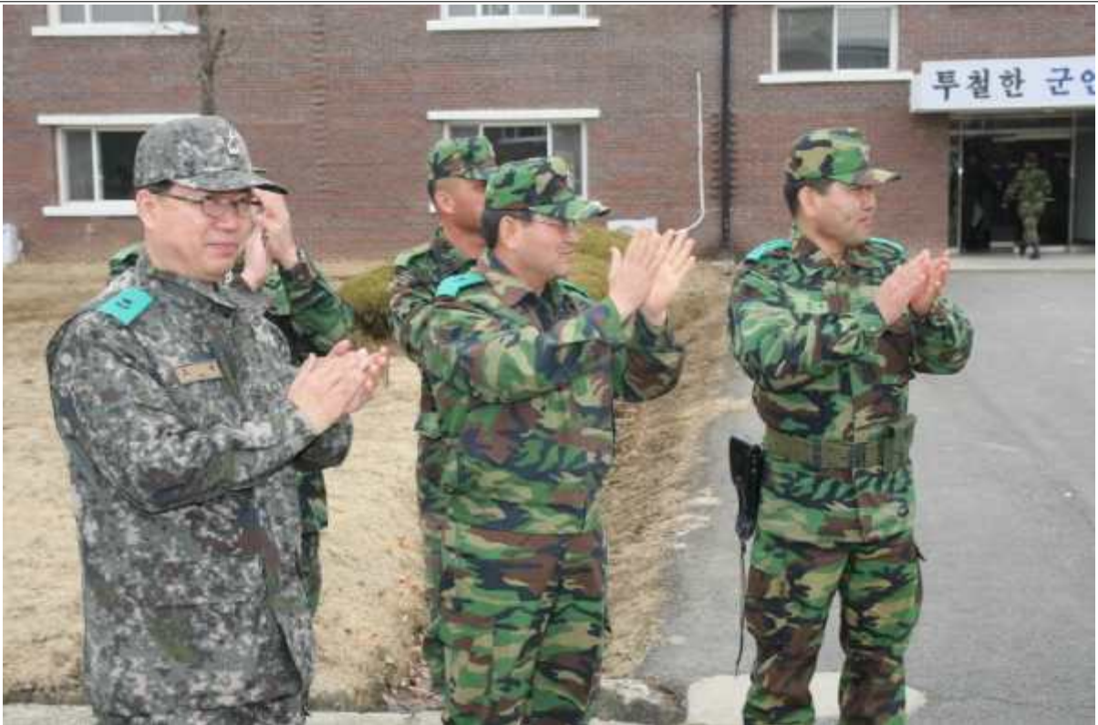
법무사관 유격입소행군 동참 (2011.3.5.)