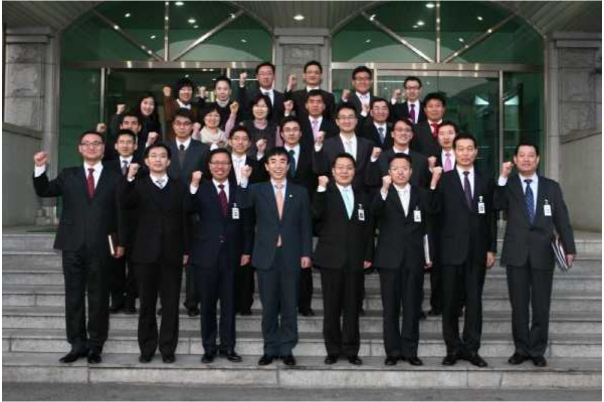
차관 복무계획보고 (2011.2.17.)