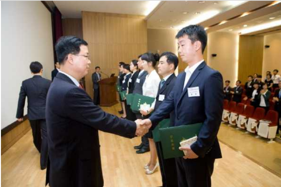
전군 군사법원서기 전문화 교육 (2011.6.22.)