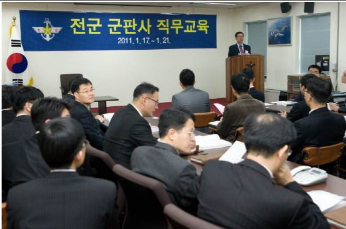
전군 군판사 직무교육 (2011.1.17.~1.21.)