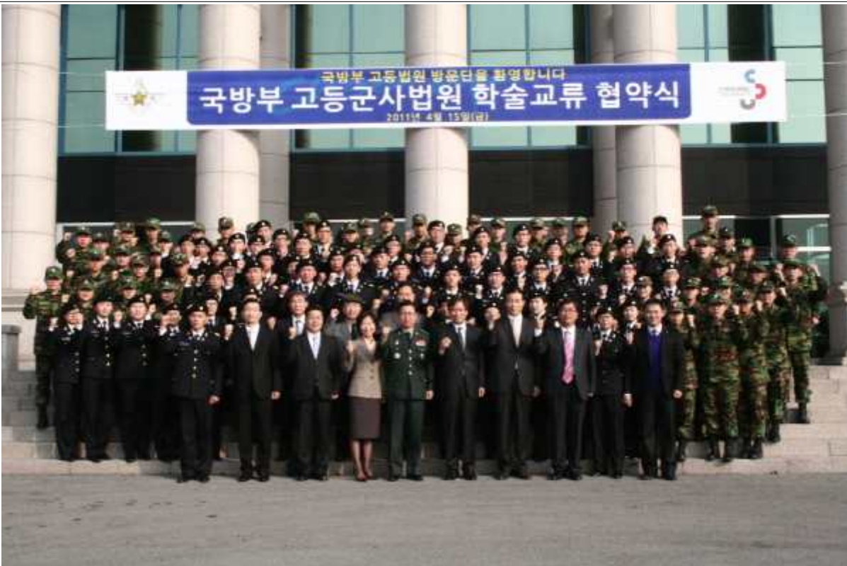
초당대학교와 군학 협력 위한 합의서 체결 (2011.4.15.)