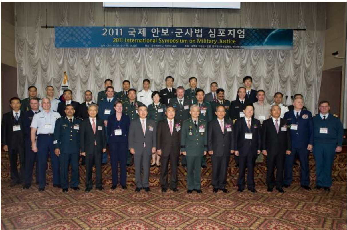
2011 국제 안보·군사법 심포지엄 개최 (2011.10.26.~10.28.)