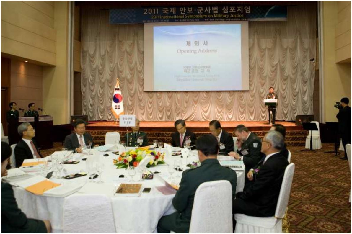
2011 국제 안보·군사법 심포지엄 개최 (2011.10.26.~10.28.)