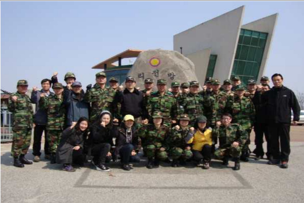
야전(15사단 38, 39연대) GOP 경계 체험 (2011.3.24.)