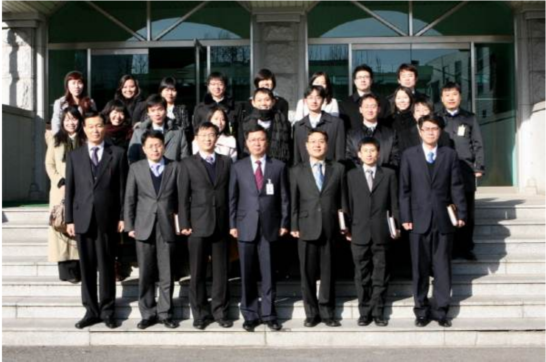
군법무관 임용 예정자 교육 (2011.1.10.)