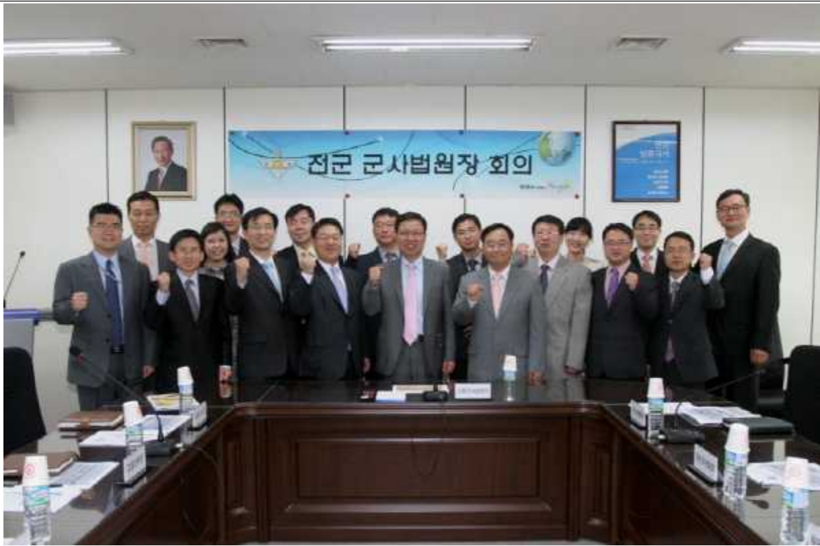
전군 군사법원장 회의 (2011.5.19.)