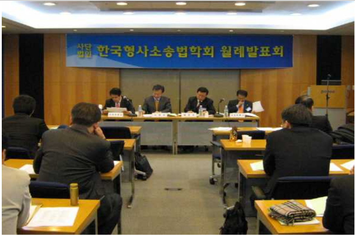
한국형사소송법학회 참석 (2011.1.21.)