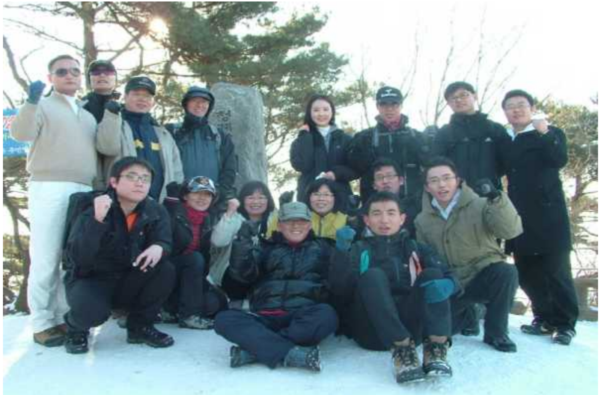
전 직원 청계산 등반 (2011.1.26.)