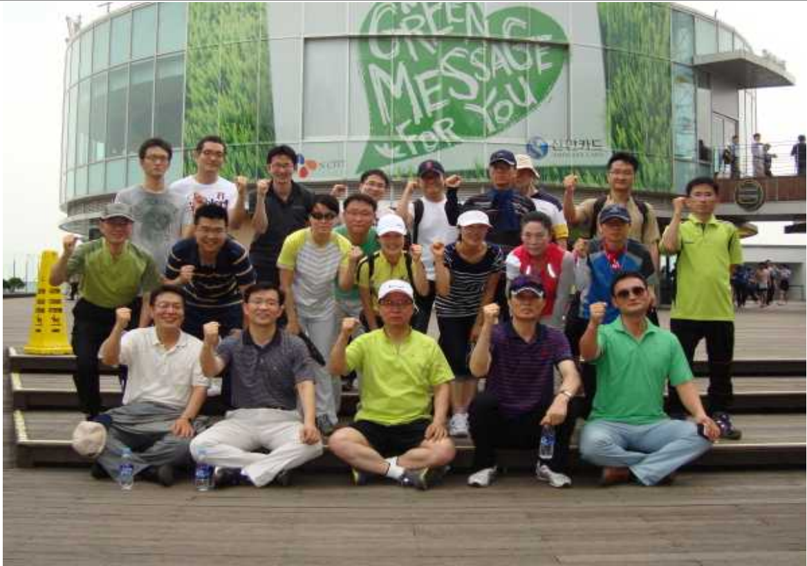
창설 제11주년 기념 행사 (2011.7.1.)