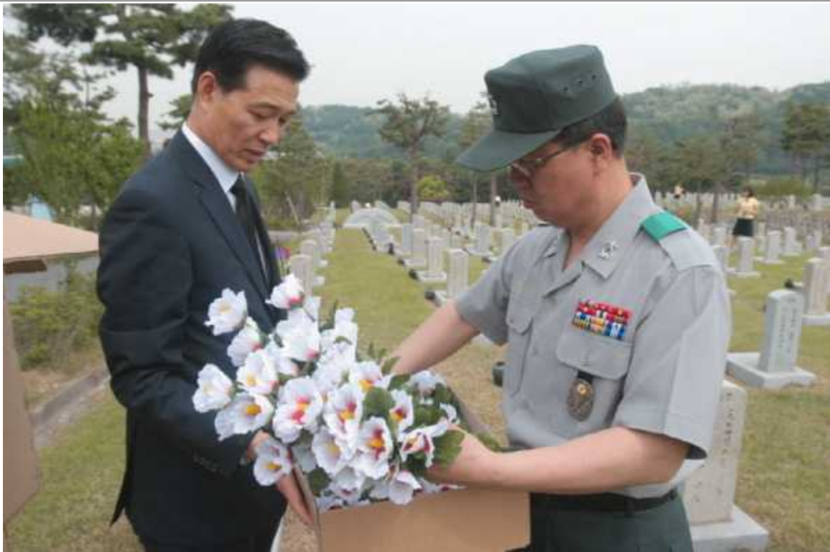
국립현충원 '한송이 헌화운동' 참여 (2011.5.25.)