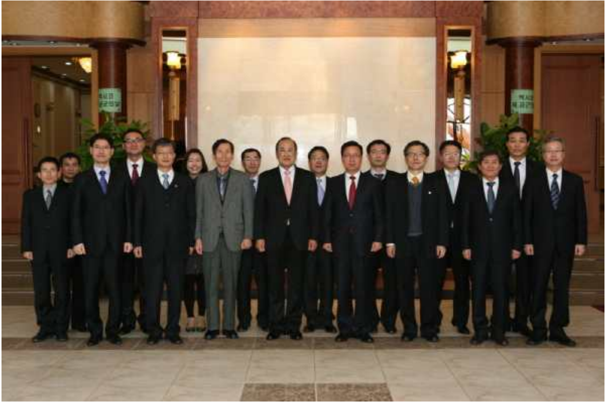
역대 법원장 초청행사 (2011.3.2.)