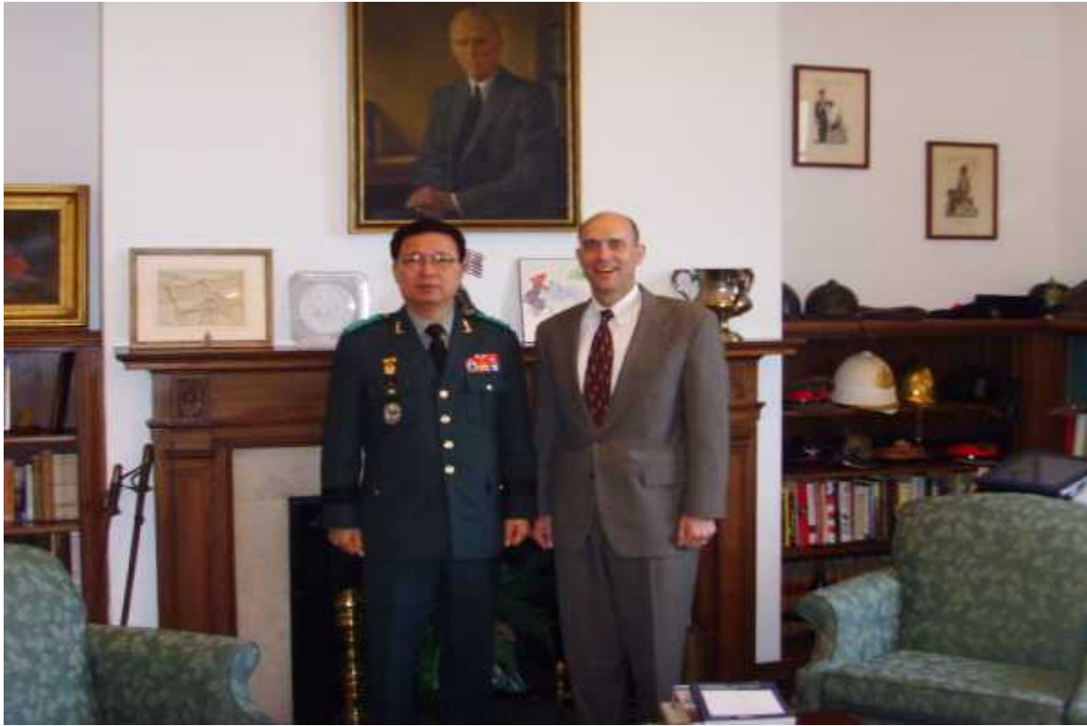
국제 군사항소법원 회의 참석 (2011.3.31.)