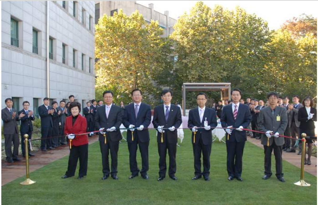
육상공원 준공식 (2011.10.18.)