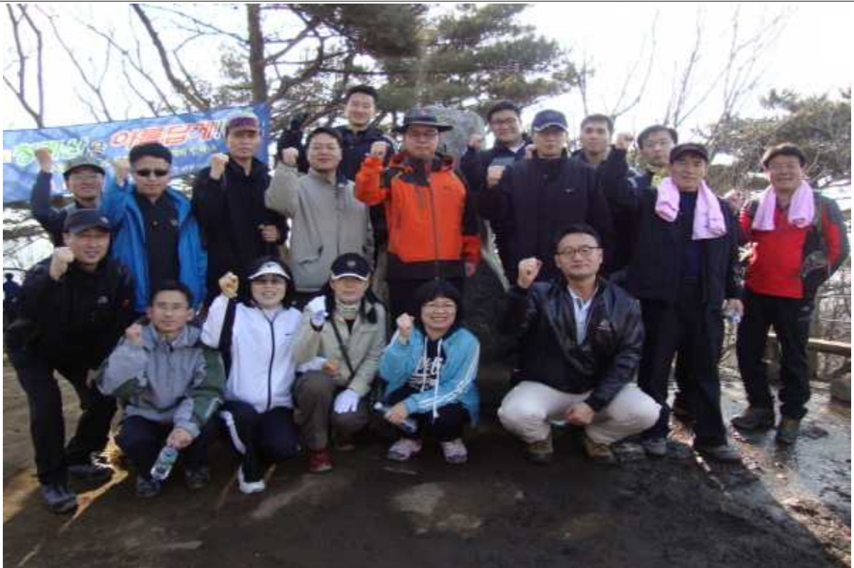
전 직원 청계산 등반 (2011.2.23.)